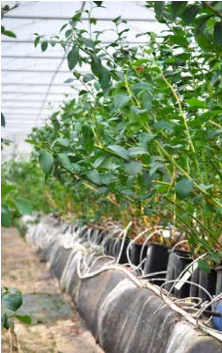
Bij containerteelt in een hogere densiteit bereik je sneller een maximale productie per hectare.