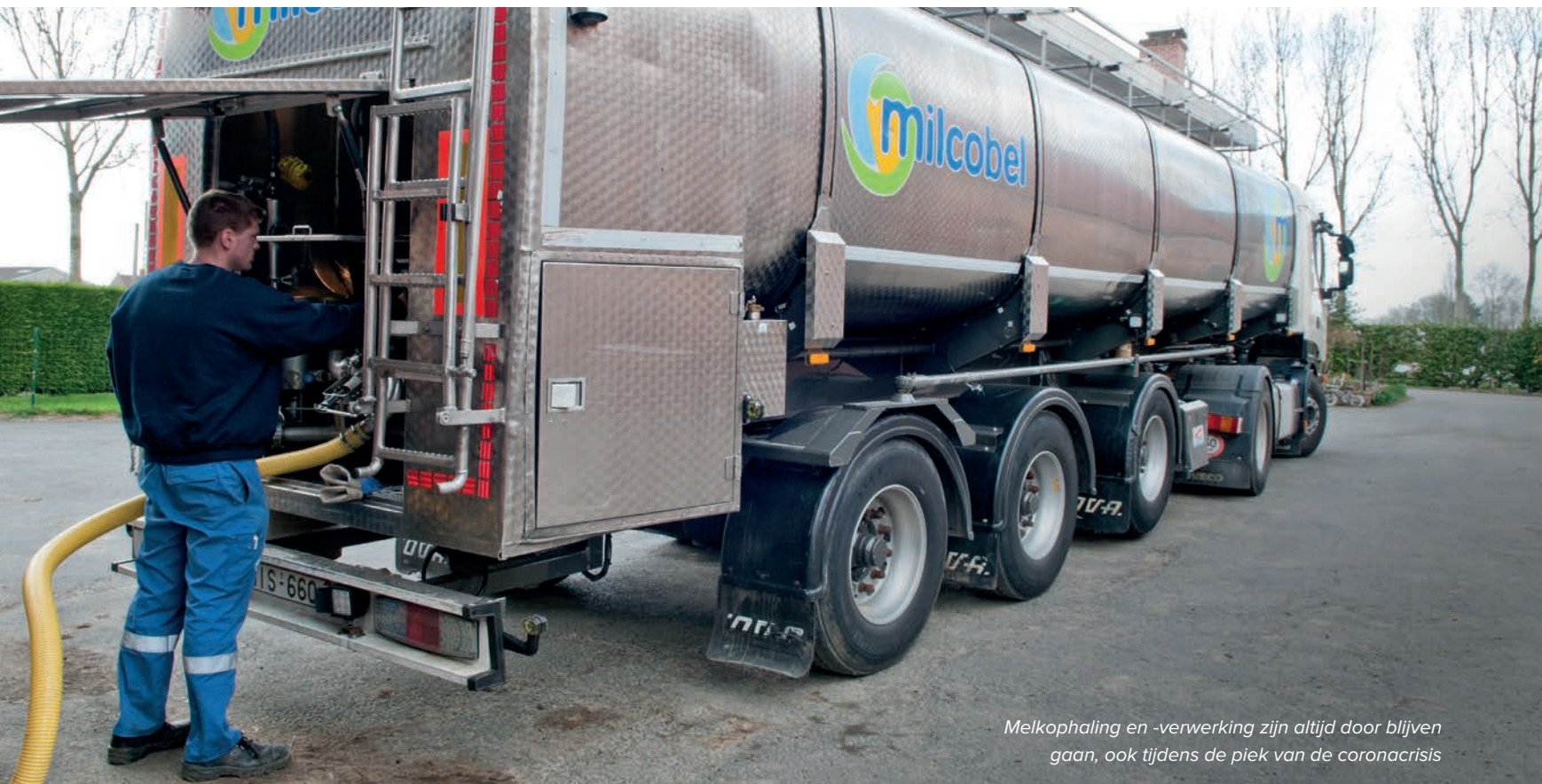
Melkophaling en -verwerking zijn altijd door blijven gaan, ook tijdens de piek van de coronacrisis