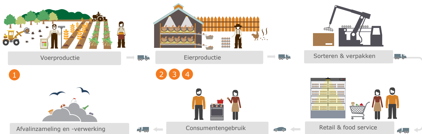
Figuur 1 Eierketen (nummers corresponderen met de hieronder beschreven relevante duurzaamheidsthema's)

food service. Na de consumptie worden de verpakking en de eierschaal veelal gescheiden ingezameld en gaan deze naar de afvalverwerking (figuur 1).