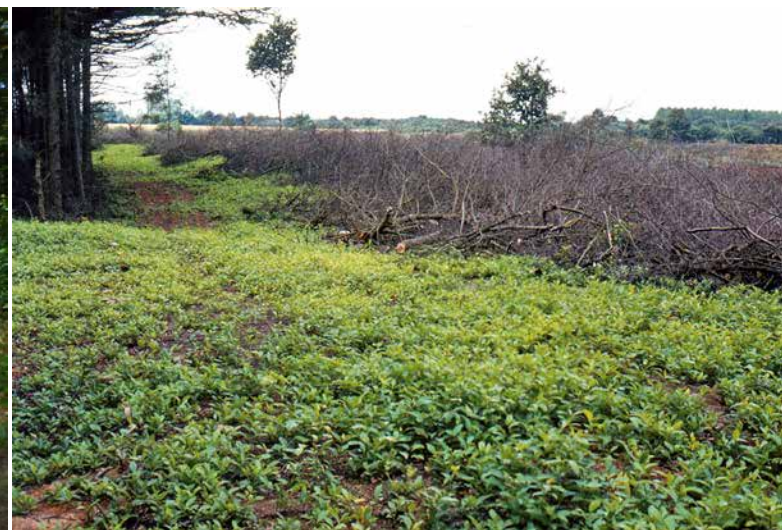
Figuur 4 (links): Bevoordelen van de Amerikaanse vogelkers door de stam bij de grond af te zetten.