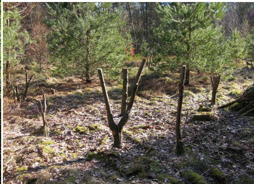
Figuur 6 (links): Bescherming van zaailingen van de Amerikaanse vogelkers met gekapt takhout.