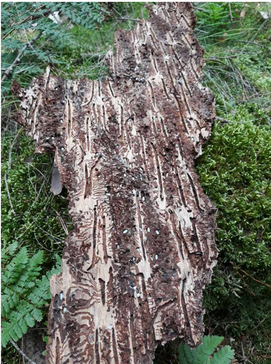
Foto onder: de typische gangen waaraan de letterzetter zijn naam dankt

Op de armere zandgronden kan natuurlijke verjonging gestimuleerd worden door bodemverwonding, maar ook door aan te planten.