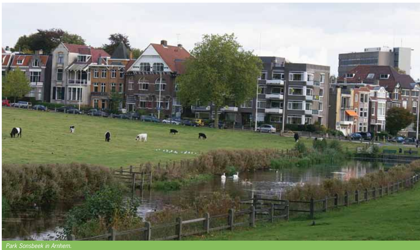
Park Sonsbeek in Arnhem.

Een van de oorzaken is dat er voor bestuurders van gemeenten weinig te winnen is bij het aanleggen van groen. Aan de goede voor-