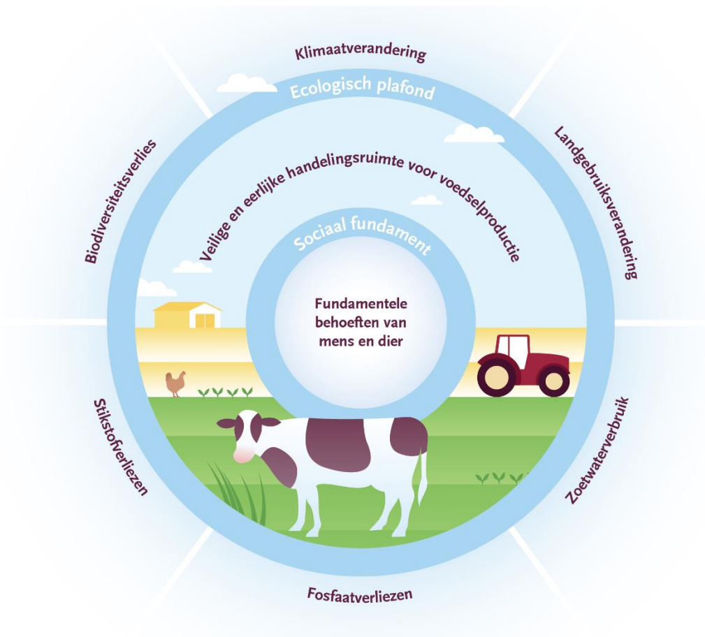
Figuur 2. Vaststellen van de veilige en eerlijke handelingsruimte voor duurzame voedselsystemen (De Boer et al., 2019). De vrije handelingsruimte voor landbouwondernemers wordt bepaald door enerzijds het ecologische plafond (bijv. stikstofverliezen en biodiversiteitsverlies) en anderzijds door het sociale fundament, onze sociaal-maatschappelijke waarden (bijv. dierenwelzijn en arbeidsomstandigheden).