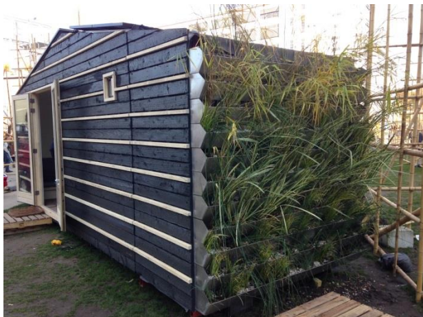
Beeld: "Tiny Tim House" in Nederland dat niet is aangesloten is op het riool (compost toilet) en drinkwaternetwerk (regenwater filtratie wand).

In de Verenigde Staten zijn er zelfs burgers die verlangen naar "rauw water". Volgens deze groep wordt er in het traditionele zuiveringsproces van drinkwaterbedrijven te veel fluoride toegevoegd en gezonde bacteriën verwijderd. Ongefilterd natuurlijk bronwater moet de nieuwe norm worden volgens deze groep. Een aantal commerciële bedrijven in de Verenigde Staten verkopen nu ook "rauw water" of verkopen de tools om dit op te vangen. Een bedrijf als Live Water bijvoorbeeld verkoopt ongefilterd