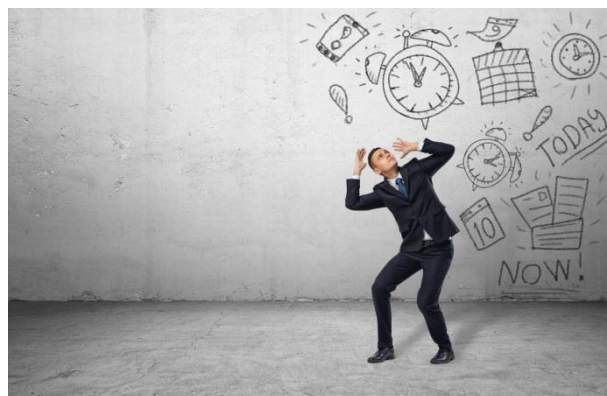
Beeld: De druk van de prestatimaatschappij leidt tot verlangen naar ontsnapping (GoStarters, 2017)

die het modern escapisme helpen verspreiden. Uit onderzoek van de landelijke studentenvakbond (LSVb) blijkt dat een op de drie studenten een verhoogde kans op een burn-out heeft. Naast de druk om te presteren, moeten jongeren ook steeds meer keuzes maken door de toegenomen mogelijkheden die op hen afkomen. Dit kan tot keuzestress leiden.