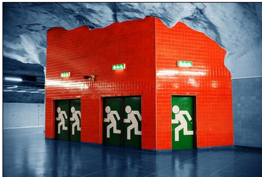
Beeld: Het zoeken naar een uitlaatklep om de dagelijkse sleur te doorbreken (Matadornetwork, 2010)

Het verlangen naar escapisme als gevolg van onze complexer wordende maatschappij neemt toe. Door de toenemende druk om te presteren en de opkomende digitalisering is het streven om af te wenden van realiteit, of vanuit de digitale wereld juist terug te keren naar de werkelijkheid, onder burgers toegenomen. Het zoeken naar escapisme kan verschillende vormen aannemen, zowel emotioneel als fysiek. De één koppelt zich af van sociale media vanwege privacy redenen en vindt de digitalisering van dienstverlening maar niks. De ander wil afstappen van de nutsnetwerken om volkomen onafhankelijk en zelfvoorzienend te worden. Wat voor gevolgen hebben dit soort vormen van escapisme voor de watersector? Voor waterbedrijven die inzetten op het betrekken van klanten, o.a. door interactie via sociale media, is het van belang om de (tegen)trend van escapisme te volgen. Wie zijn die burgers die fysiek of emotioneel niet langer aangesloten willen zijn? Is deze groep 'escapers' groeiende ten opzichte van de 'betrokken' burgers?