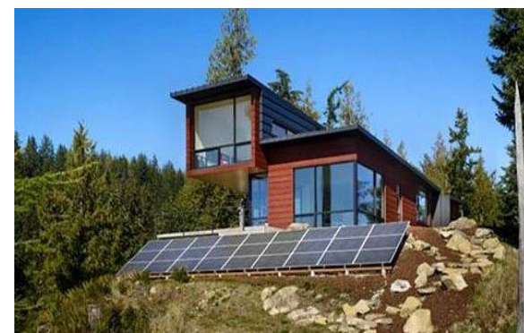
Beeld: Autarkisch wonen in Amerika (Mother Nature Network, 2017)

verliezen als gevolg van deze zogenaamde "vraagverstoring" door energie efficiëntere maatregelen en gedecentraliseerde energieopwekking. Over wat voor een bedragen dit zou gaan als het om water gaat is niet bekend, maar dat het aanzienlijk kan zijn geeft dit energie voorbeeld wel aan.