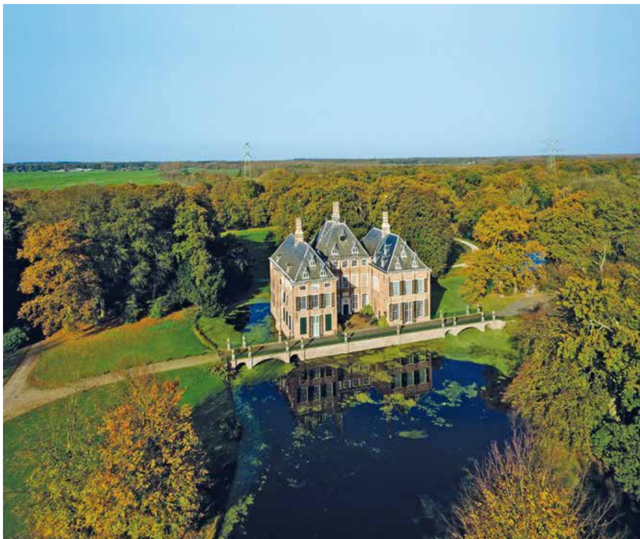
Figuur 2. Kasteel Duivenvoorde, een van de landgoedkastelen op de strandwal van Wassenaar.

“Het Nationaal Park Hollandse Duinen heeft een heel eigen karakter doordat het midden in de Randstad ligt”, vervolgt Georgette. “Cultuur en natuur zijn hier nauw met elkaar verbonden. Er wonen alles bij elkaar meer dan een miljoen mensen op korte afstand van internationale topnatuur: de zee, het strand, de duinen,