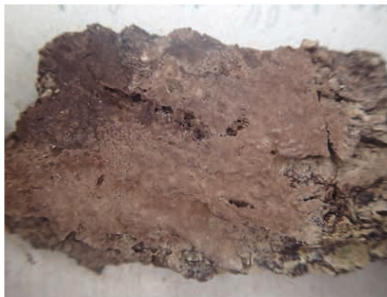
Figuur 2. Tomentella umbrinospora .