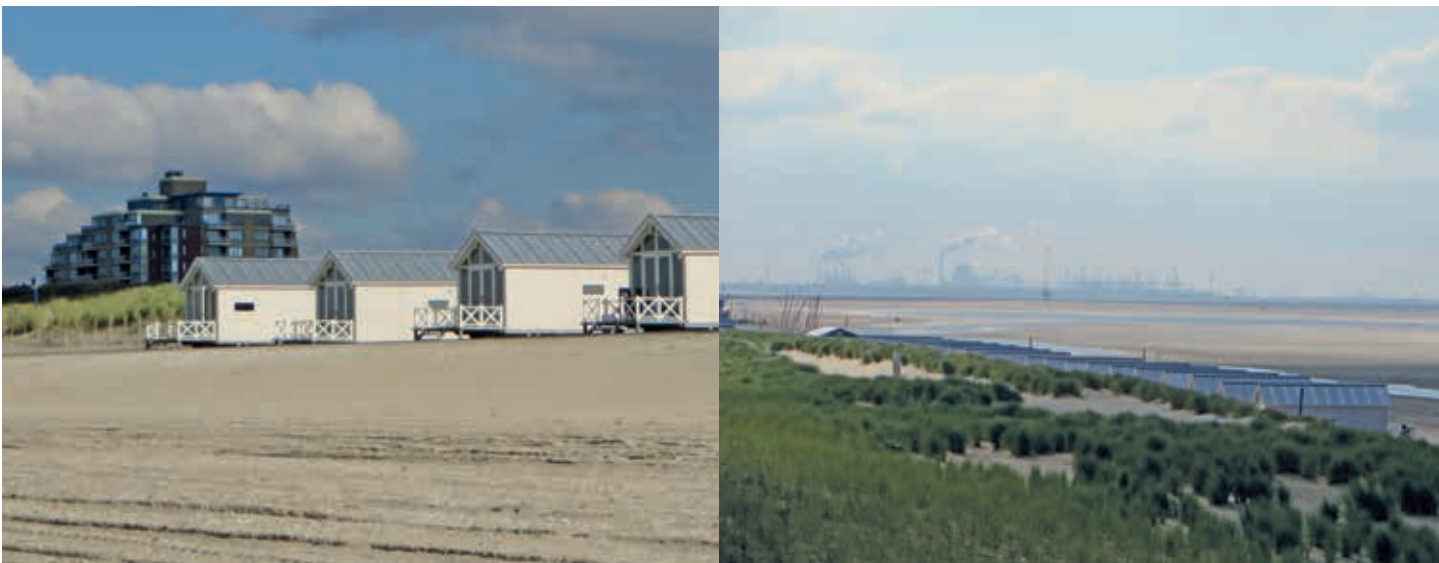
Figuur 1. Strandhuisjes aan de voet van de zeereep ten zuiden van Kijkduin. Links: foto vanaf het strand, rechts: foto genomen vanaf het zuidelijke uitzichtpunt van de boulevard van Kijkduin met in de achtergrond de Maasvlakte.

Met het ontwerp Actualisering VRM (PZ-H 2016) reageert Provincie Zuid-Holland op de maatschappelijke onrust die ontstond na het kabinetsvoornemen om het verbod op bebouwing aan de kust op te heffen. Strandgedeelten die langs Natura 2000 duingebieden liggen worden in de herziene visie uitgesloten van bebouwing. Er blijft wel ruimte om aangrenzend aan de badplaatsen bouwactiviteiten uit te breiden, ook al liggen die bij Natura 2000 gebieden. Deze optie was daags na de uitspraak van minister Schultz besproken in het Provinciaal Overleg Kust (POK) (mond. meded. Hans Lucas), een overlegorgaan waar Rijkswaterstaat, provincie, waterschappen, drinkwaterbedrijven en