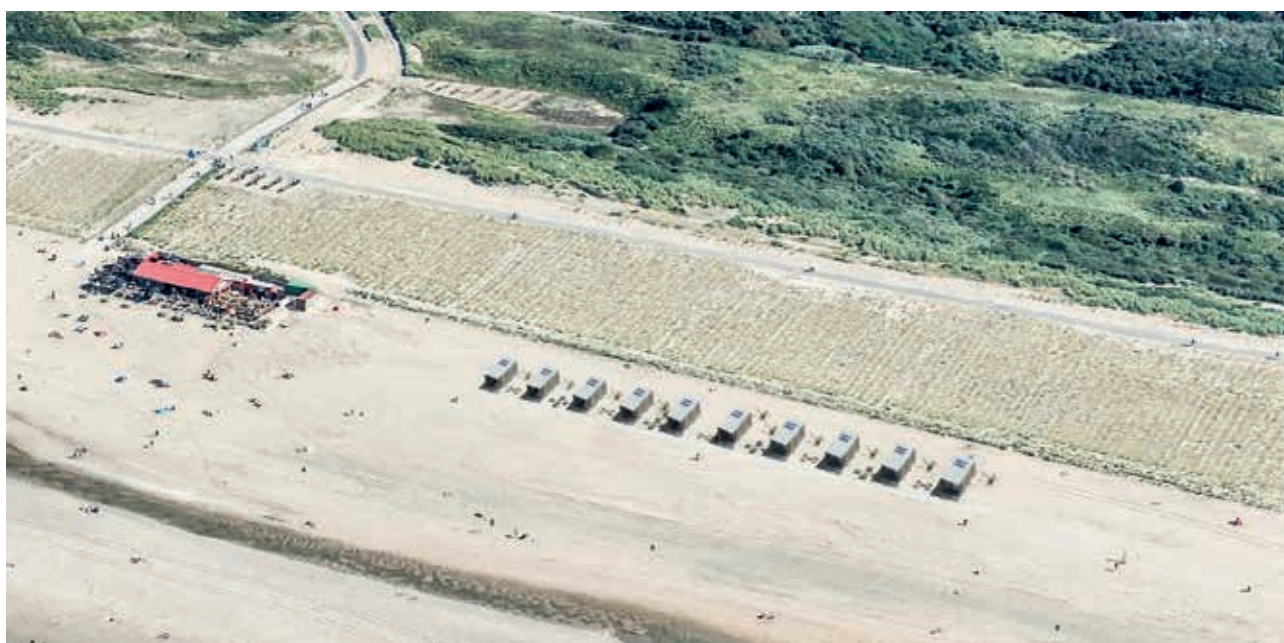
Figuur 3. Artiest impressie van tien strandhuisjes die in 2017 ten zuiden van Strandslag 2 geplaatst zullen worden. Tien zelfde strandhuisjes zullen tussen Strandslag 2 en 2a komen te staan.

nog lastiger, omdat er ook andere factoren meespelen en er autonome trends zijn. Zolang het niet duidelijk is wat de effecten van kustbebouwing op de natuur is, gebiedt het voorzorgsprincipe dat kustbebouwing dan niet plaats mag vinden. Bebouwing aan de kust kan verstoringen opleveren, die mogelijk te traceren zijn via broedvogelinventarisaties en zoogdiertellingen voor en na een bouwproject. Ook kunnen vlermuizen verstoord worden door toegenomen lichthinder. Een bijkomend effect van de aanleg van meer paviljoens en strandhuisjes zal zijn dat het strand meer en vaker gebulldoerd wordt, hetgeen elk natuurlijk proces op het strand zelf onderdrukt. Daarnaast zijn er infrastructurele aanpassingen nodig, zoals riolering en de aanleg van extra toegangswegen en parkeerplaatsen.