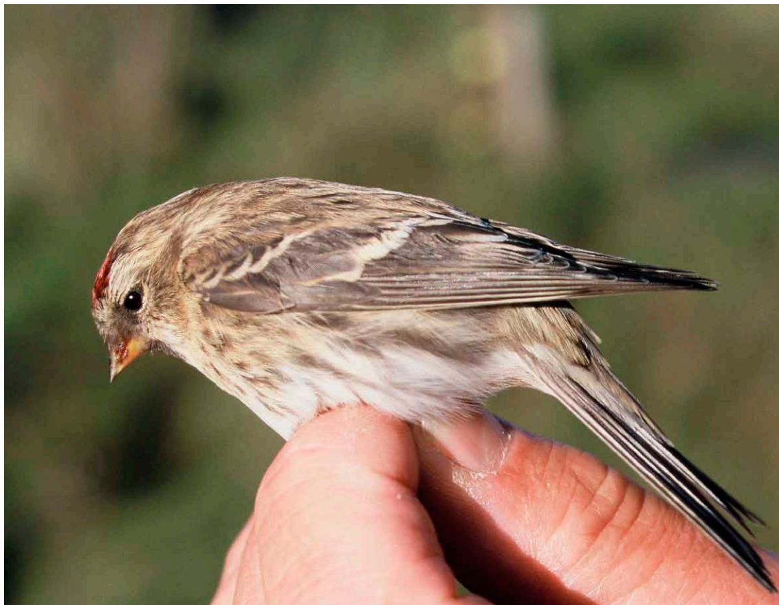
Figuur 2. Grote barmsijs ( Carduelis flammea ), vrouwtje, Meijendel, Wassenaar, 15 november 2005. Deze vogel droeg een ring uit China: de eerste Chinese ring in Nederland.

Een van de hoogtepunten van tien jaar ringen was de misschien wel meest onverwachte terugmelding in Nederland ooit: op 15 november 2005 hing een vrouwtje Grote Barmsijs ( Carduelis flammea ) met een Chinese (!) ring in een mistnet. De vogel bleek op 16 november 2004 geringd in Nenjiang, in de provincie Heilongjiang, noordoost China (49 N, 125 O). Tussen de 364 dagen van de vangst en de terugvangst heeft de vogel hemelsbreed 8.515 km afgelegd. Figuur 2 toont een afbeelding van de vogel in kwestie. Niet eerder is in ons land een vogel met een Chinese ring gevangen. Qua afstand is dit voor Nederland tevens de meest oostelijke terugvangst van een vogel ooit.