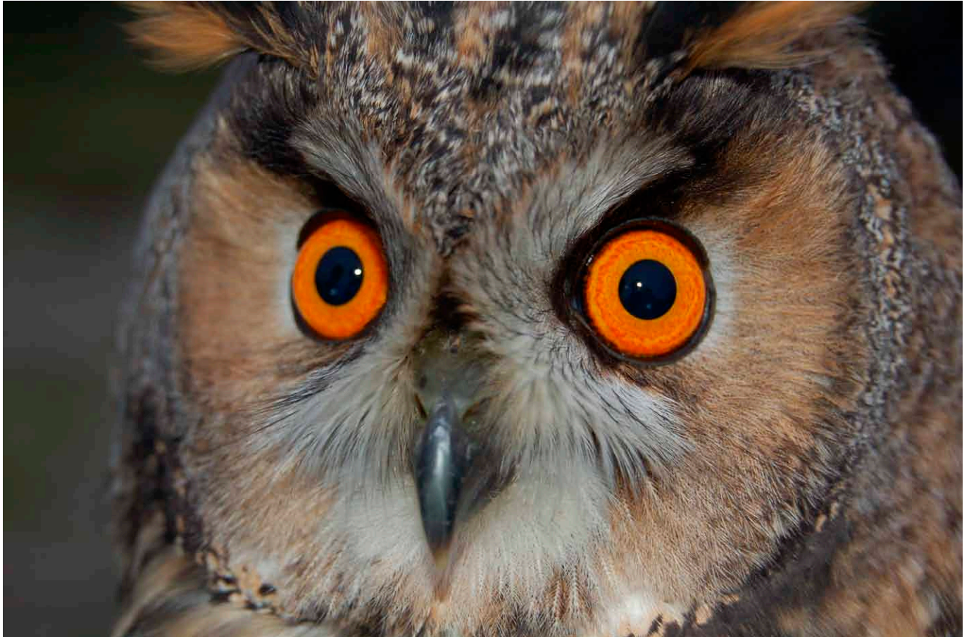
Figuur 1. Ransuil ( Asio otus ), Meijendel, Wassenaar, 7 november 2008.

Vincent van der Spek, Maarten Verrips en Rinse van der Vliet Vogelringstation Meijendel Acaciastraat 212, 2565 KJ, Den Haag