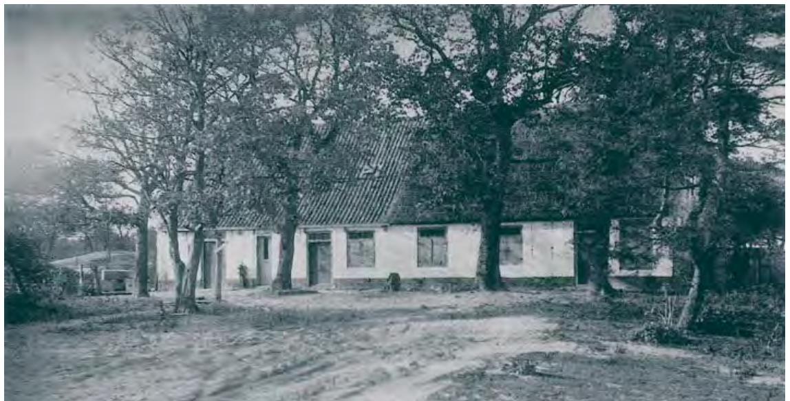
Figuur 3. Boerderij Solleveld omstreeks 1910. Links zien we het stalgedeelte met dakpannen, rechts het woonhuis met rieten dak. De gevel is witgekalkt met een zwarte teerrand. De luiken zijn gesloten. Het erf is niet bestraat, langs het huis loopt een klinkerpadje. Tegen de stal staat een ijzeren zwengelpomp (uit: J.N.M. van Leeuwen, 1993).

Gelijktijdig met het onderzoek in het veld werd gespeurd naar gegevens over de boerderij Solleveld in de archieven en in boeken. In het Haags Gemeentearchief bleek een aantal foto's aanwezig met de aanduiding Solleveld en datum ca. 1900. De foto's laten echter een boerderij zien die niet overeenkomt met de gevonden fundering. De plaats van de deuren op de plattegrond moet immers dezelfde zijn als die van de deuren op de afbeelding. Een afbeelding van de boerderij Solleveld uit ca. 1910 staat in een boek over de geschiedenis van de Westlandse drinkwaterwinning (Van Leeuwen, 1993) en de foto van 1935 komt uit het tijdschrift De Levende Natuur (Broekhuysen, 1937).