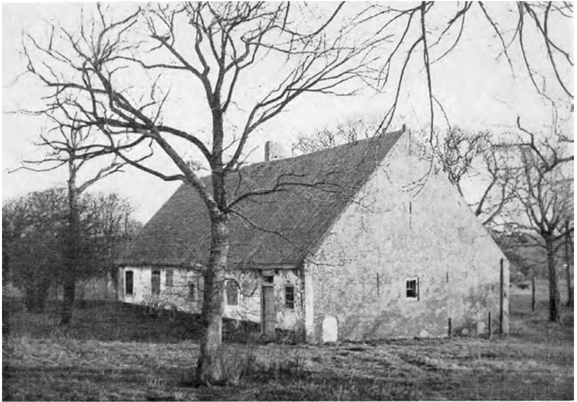
Figuur 4. Boerderij Solleveld in 1935, Let op de grupopening in de linkerhoek van de vrijwel blinde zuidgevel van de stal. Ook de staldeur aan de zeezijde komt overeen met de plattegrond. Goed is de schoorsteen te zien die in de woonkeuken uitkomt (uit: De Levende Natuur, 1937).

Medewerkers van het Loosduins Museum vonden gegevens over eigenaren en pachters uit de 19 e eeuw, de kadastrale opmeting uit 1832 en de beschrijving van boerderij Solleveld bij een verkoop in 1863. Bij voortgezet archiefonderzoek werden nog meer gegevens, vooral uit de 17 e en 18 e eeuw, gevonden. Belangrijk was ook de informatie over de Zuid-Hollandse boerderij uit het boek van Le Francq van Berkhey uit 1811.