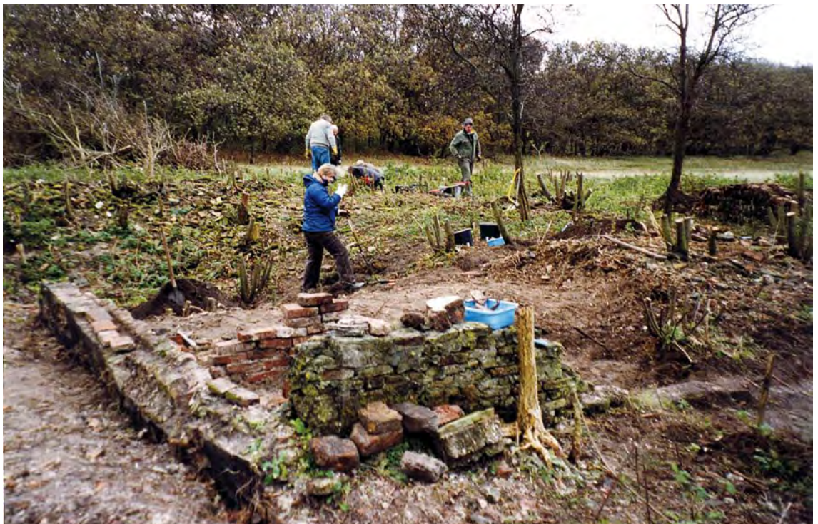
Figuur 1. Opgraving boerderijruïne Solleveld eind 2004.

Op veertien zaterdagen van 9 oktober 2004 tot 19 februari 2005 is gewerkt aan het vrijmaken en optekenen van de grondslagen van de boerderij Solleveld.