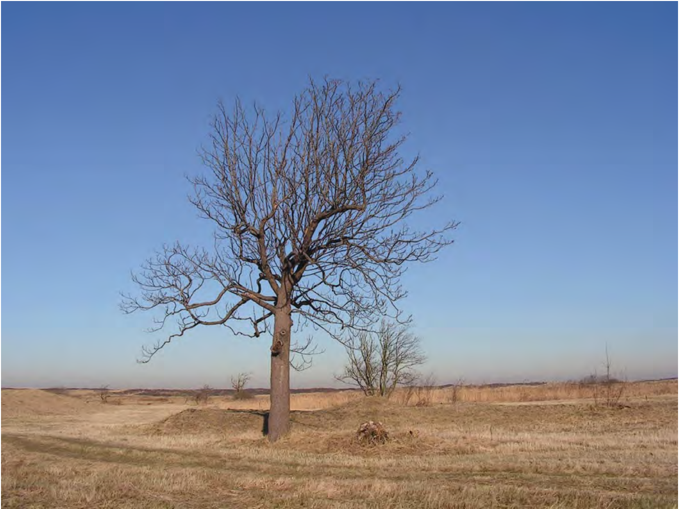
Figuur 6. Plek van de voormalige boerderij Solleveld met kastanje, winter 2007-2008.

De boerderij Solleveld was bijna in het duinlandschap onder het zand en de begroeiing verdwenen, zoals het eerder met andere boerderijen en landschapselementen gebeurde. Te denken valt aan het Merovingische dorp en grafveld, gegraven wateringen en sloten, allerlei grenswallen en bijvoorbeeld ook de vinkenbaan bij Ockenrode en de schietbaan naast Blijrust. De duinen tussen Den Haag en Monster hebben zo'n rijke geschiedenis, dat men er voortdurend op bedacht moet zijn bij grondwerkzaamheden op artefacten uit het verleden te stuiten. Telkens werd het landschap opnieuw ingericht, vonden overstuivingen plaats en daalde of steeg het grondwater. Cultuurresten in dit duinlandschap, dat tegenwoordig belangrijke functies als natuur, zeewering en drinkwaterwinning heeft, verdienen bewaard te blijven. En dat is nu – na documentatie – met de ruïne Solleveld gebeurd!