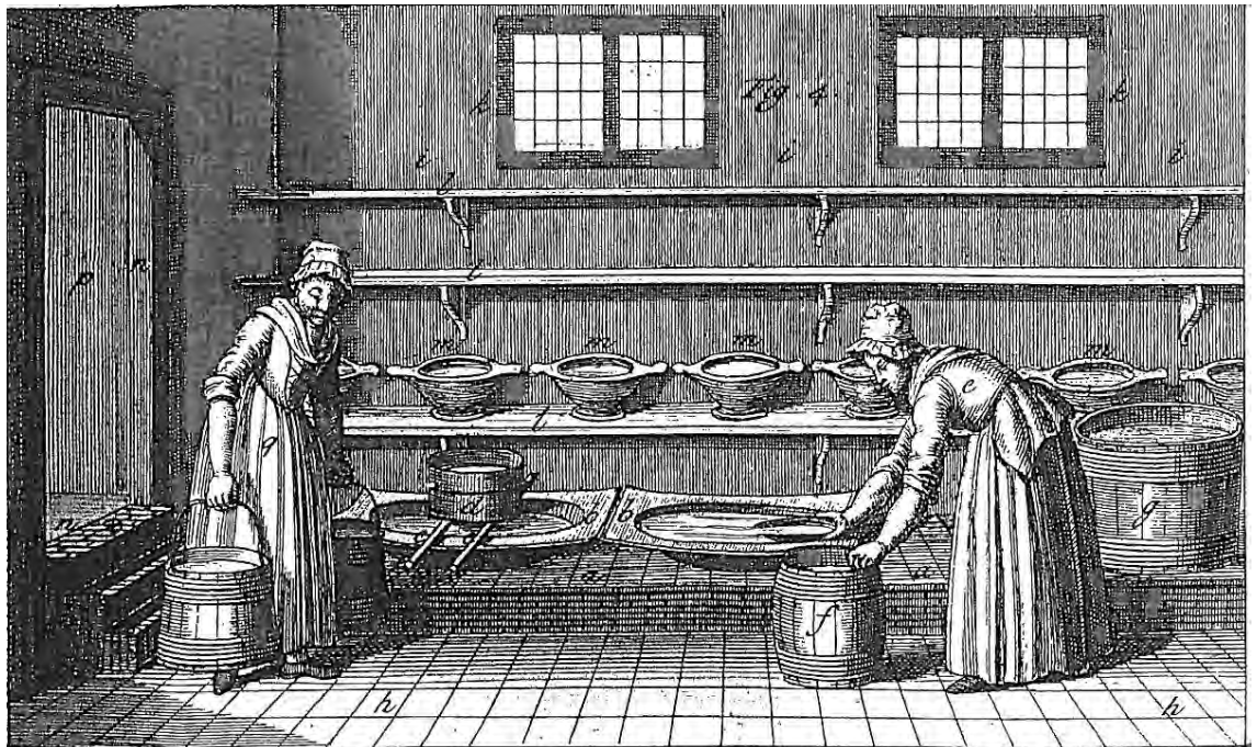
Figuur 5. Melkkelder van een Zuid-Hollandse boerderij (uit: Le Francq van Berkhey, 1811). In twee grote melkmouwen en zeven kleinere aardewerk testen vormt zich op de melk verse room, die daarna tot boter wordt gekarnd.

De vloer van de melkkelder was waterdicht gemaakt met tras en ongeglazuurde plavuizen. Op de wanden zaten mogelijk 17 e -eeuwse hergebruikte blauwe tulptegels, waarvan we enkele scherven los terugvonden. Het prentje uit Le Francq van Berkhey (1811) geeft een goed idee van het gebruik van een dergelijke kelder.