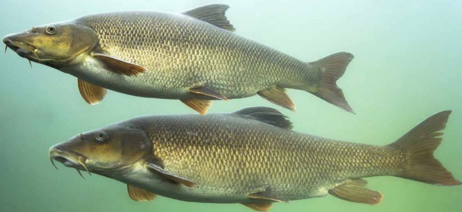
Gespecialiseerde rivierissen zoals de barbeel profiteren nog onvoldoende van de maatregelen gericht op het herstel van uiterwaarden.

Omdat alleen het hiervoor beschreven grootschalige onderzoek niet geschikt is voor dit niveau van complexiteit, vinden in juni en september (2018-2020) op 26 locaties langs de Rijntakken aanvullende bemonsteringen plaats. Deze hebben als doel een inschatting te kunnen maken van de verandering in habitatgebruik van jonge vis tijdens het seizoen. Dat is belangrijk omdat veranderend habitatgebruik iets kan zeggen over welke habitats wanneer belangrijk zijn en welke mogelijk beperkend zijn voor de ontwikkeling van vis in uiterwaarden.