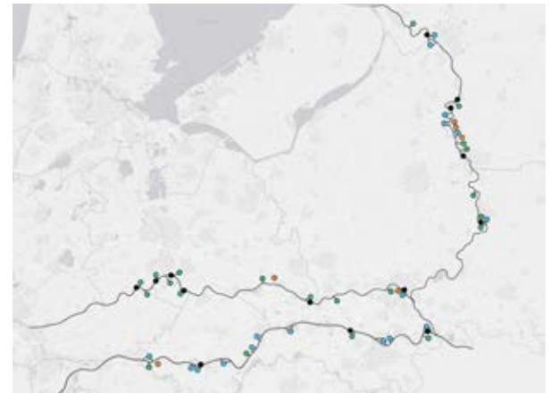
Een overzicht van de herstelde uiterwaarden langs de Rijntakken binnen het onderzoek (illustratie: Twan Stoffers).

van de ecologische kwaliteit van het hele riviersysteem. Een van de maatregelen die de rivier meer ruimte gaf en bedoeld was om ook de ecologie te verbeteren was het opnieuw verbinden van een aantal uiterwaarden met de hoofdstroom. Ondanks veel van dergelijke herstelmaatregelen in de uiterwaarden van de Rijntakken, lukt het tot op heden echter niet de dichtheden van rheofiele vissoorten in de hoofdstroom weer op een gewenst niveau te krijgen. Met name de dichtheden van sneep ( Chondrostoma nasus ), serpeling ( Leuciscus leuciscus ), kopvoorn ( Squalius cephalus ) en barbeel ( Barbus barbus ) blijven achter. Deze soorten maken van oudsher in meer of mindere mate gebruik van uiterwaarden als paai- en opgroei-gebied. Een van de mogelijke verklaringen voor het achterblijvende herstel van deze soorten heeft te maken met de manier waarop uiterwaarden zijn ingericht en worden beheerd. Veel van de herstelde uiterwaarden zijn maar enkele maanden per jaar mee-stromend met de hoofdstroom en hebben bij aanleg een erg eentonig habitat. Het idee was dat dit door een proces van natuurlijke successie vanzelf zou verbeteren en er uiteindelijk een breed scala aan habitats zou ontstaan. Dit is de voorwaarde voor een hoge ecologische kwaliteit van uiterwaarden. Eisen aan de veiligheid, scheepvaart en andere gebruiksbelangen leggen in Nederland echter beperkingen op aan het rivierbeheer. ➤