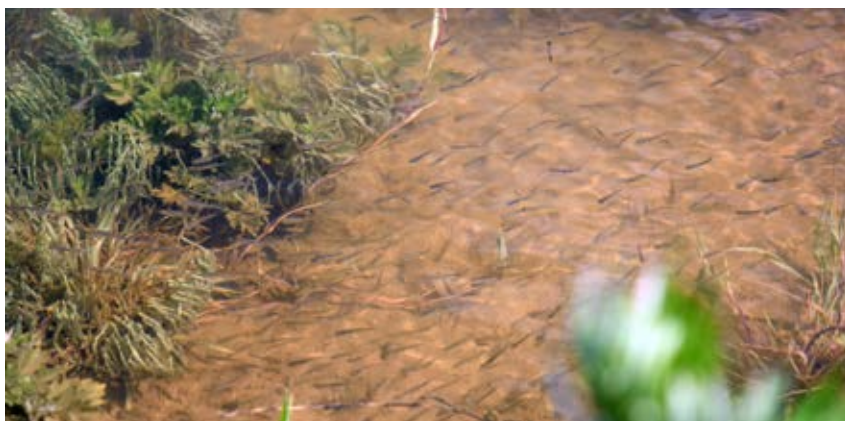
Tussen ondergelopen vegetatie in ondiep, snel opwarmend habitat werden talrijke vislarven gevonden. (foto: Tom Buijse).

De extreem hoogwaterstanden in de Nederlandse grote rivieren in 1993 en 1995 waren aanleiding voor het programma 'Ruimte voor de rivier', met als belangrijkste doel het tegengaan van overstromingen. Gelukkig bleek dit vaak hand-in-hand te gaan met de verbetering