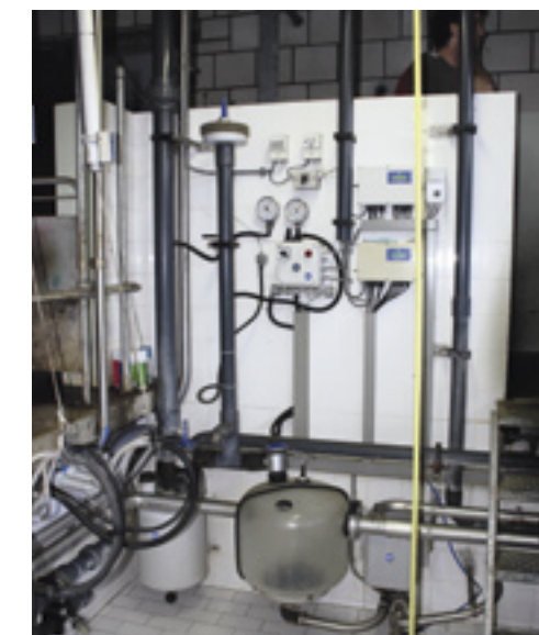
De melkinstallatie behoort elk jaar te worden doorgemeten.