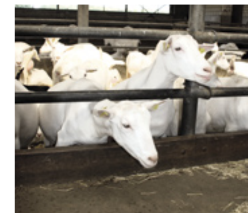
Het voer voor de geiten mag niet beschimmeld zijn.