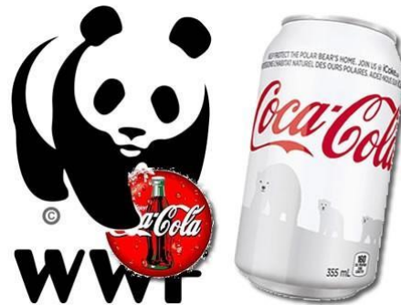
Beeld: Coca-Cola en het WNF werken sinds 2007 samen o.a. om "de zoetwatervoorraden in de wereld te beschermen".

Natuur Fonds, ook wel marketing- en imagodiensten levert in ruil voor donaties. Formeel is een donatie een schenking of gift waarvoor de begiftigde geen tegenprestatie verschuldigd is. Maar neem bijvoorbeeld het project van het WNF waar rivierenlandschappen in het Verenigd Koninkrijk worden beschermd met een donatie van The Coca-Cola Foundation. Of de internationale campagne ' Arctic Home ' waarvoor Coca-Cola twee miljoen dollar aan het WNF donderde voor bescherming van de Noordpool (zie beeld hieronder). Op televisie, gedrukte en digitale advertenties, maar ook promoties in winkels, is de samenwerking zichtbaar.