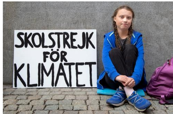
Greta Thunberg (15) aan het staken voor het klimaat voor het parlamentsgebouw in Stockholm