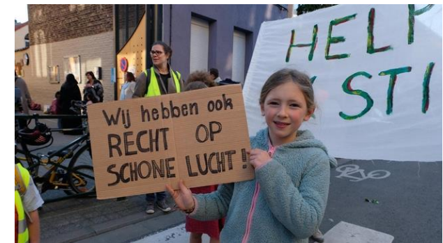
Beeld: Recht op schone lucht

minder geboortes met laag geboortegewicht, en 1.500.000 dagen minder ziekteverzuim. Na het winnen van het kort geding door Milieudefensie in 2017, ging de Staat in hoger beroep tegen een van de eisen uit het vonnis. De Staat kreeg 27 december 2017 hierin gelijk en nu is Milieudefensie weer tegen deze uitspraak in hoger beroep gegaan. Voor de zitting van dit hoger beroep is nog geen datum gepland, maar de rechter zal waarschijnlijk begin 2019 een definitieve uitspraak doen.