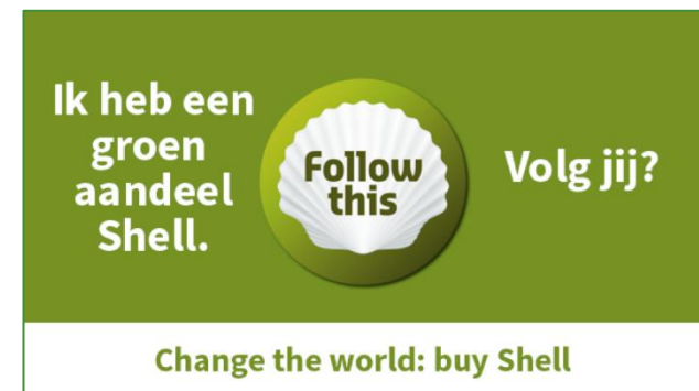
Beeld: Activistische beleggers - Follow This

Follow This heeft een resolutie opgesteld waarmee ze Shell wil dwingen om bedrijfsdoelen te stellen die in lijn zijn met het Parijsakkoord. Op 14 april 2018 adviseerde Shell zijn aandeelhouders tegen de resolutie van Follow This te stemmen. Volgens Shell is de resolutie niet in het belang van de onderneming. Dit was het derde jaar op rij dat de groep een klimaatresolutie inbracht, maar op 22 mei 2018 waren ze meer succesvol dan ooit.