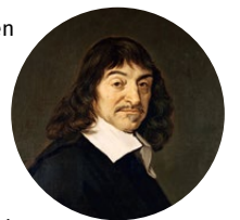
↑ René Descartes

heeft, dan kun je zonder problemen een pasgeboren kalf bij de moeder weghalen of een paard laten werken tot het erbij neervalt. De Franse wijsgeer Descartes (1596-1650) beweerde dat dieren geen ziel hebben, noch gevoel en emoties. Hij vergeleek het geluid van een dier dat gilt van pijn, met het gefluit van een fluitketel. Een geluid dat automatisch ontstaat en waaraan dus geen gevoelens ten grondslag liggen. Dat maakt het een stuk gemakkelijker om een stukje van die pup af te knippen of dat paard nog even te laten doorploegen. De bewering dat dieren gevoelens en emoties hebben heeft de afgelopen decennia enorm aan kracht gewonnen en hoewel er soms nog wetenschappers opstaan die het tegendeel beweren, is het overgrote merendeel van de dierenliefhebbers er rotsvast van overtuigd: dieren hebben gevoelens en emoties en ze dienen met respect behandeld te worden.