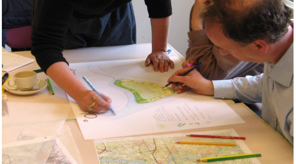
Bosuitbreiding vergt zorgvuldig ontwerp en ruimtelijke inpassing

opnieuw uit te vinden. Het Meerjarenplan Bosbouw (1984) en het Bosbeleidsplan (1993) kenden ook al ambitieuze bosuitbreidingsdoelstellingen. Een deel daarvan is gerealiseerd en een deel niet. Laten we daarvan leren om te zien welke (beleids)instrumenten effectief kunnen worden ingezet en hoe het proces naar