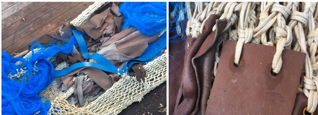
Figuur 4.1 en 4.2 Jakleerstrips.

Jakleer is door Peter Koning geïmporteerd uit Mongolië en is de afgelopen jaren in eerdere fases van VisPluisVrij qua ontwerp en dikte aangepast. De in fase 6 geteste versie is daarvan het 'eindmodel' en bestaat uit rechthoekige 'strips' die met twee bevestigingspunten aan de bovenkant aan het net vastgemaakt worden.