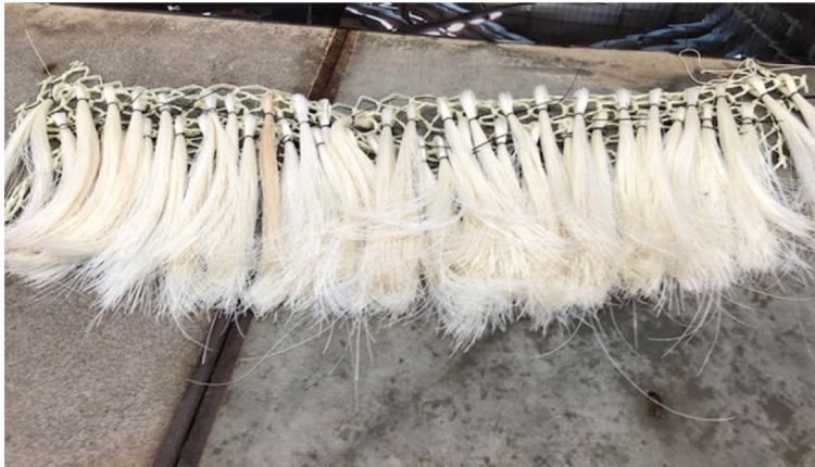
Figuur 3.1 Draden van biopolymeren.

Dit materiaal is gemaakt van biopolymeren en ziet er vergelijkbaar uit als conventioneel pluis (draden). In tegenstelling tot conventioneel pluis, dat gemaakt is van polyethyleen, is dit materiaal gemaakt van een combinatie van in (zee)water afbreekbare biopolymeren. Dit biodegradeerbare pluis is ontworpen en geproduceerd door Senbis.