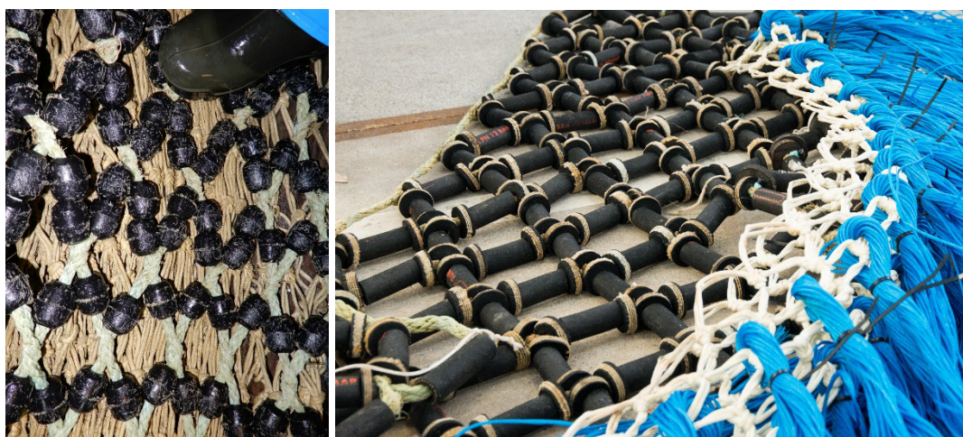
Figuur 6.1 en 6.2 Klossen met touwwerk aan boord van de TH10 (originele versie) en in het Innovatiecentrum (aangepaste versie), inclusief conventioneel pluis (blauw).

Dit materiaal is oorspronkelijk tijdens fase 5 door VisPluisVrij met medewerking van Ymuiden Stores uit Frankrijk geïmporteerd. In fase 6 is dit materiaal qua ontwerp verder aangepast door de bemanning van de TH10 om het nog robuuster en slijtvaster te maken. Hierbij zijn de klossen vervangen door kabelschijfjes (restanten van gebruik bij twinrignetten) en het touwwerk omhuld met gridslangen die normaal gesproken op de pulsstrengen bevestigd zijn. Hieronder staan foto's van de originele versie en de aangepaste versie.