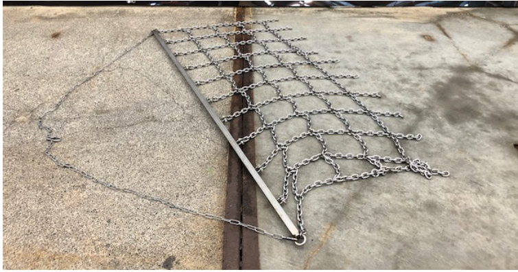
Figuur 2.1 Apparaat waarmee de weerstand en slijtage van materialen gemeten is.

Aansluitend op deze tests zijn de resultaten door het Visserij-innovatiecentrum Zuidwest-Nederland in samenwerking met Wageningen Economic Research op 27 oktober 2017 in Stellendam gedeeld met de betrokkenen.