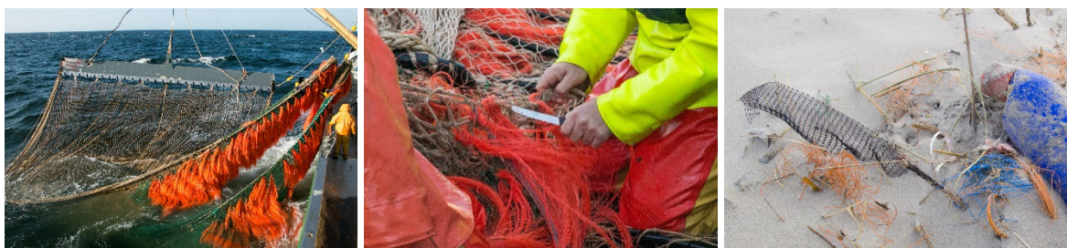
Pluis onder het achtereinde van een sleepnet, onderhoudswerkzaamheden aan pluis en pluis op het strand.

Omdat vispluis bestaat uit dunne plastic draden, kan dit door schuring over de zeebodem echter makkelijk afbreken en in zee terecht komen. Ook komt een deel van het pluis tijdens het onderhoud aan visnetten in zee terecht. Op basis van eerdere inschattingen die in het kader van VisPluisVrij gemaakt zijn, komt vanuit verschillende visserijen in de Noordzee op deze manier meer dan 50-100 ton pluis in zee terecht.