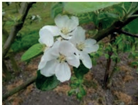
De bloesem van de Schager Rood heeft een ondiepe kelk.

In 2002 werd de POMologische Vereniging Noord-Holland opgericht. Zij stelt zich ten doel het behoud van hoogstamfruitbomen te stimuleren door middel van cursussen, activiteitendagen en adviezen over rassenkeuze, ziektebestrijding, snoei en aanplant. Het kwartaalblad van POM Noord-Holland bevroeg in 2009 een der actiefste leden van de vereniging, Henk Houtman, over zijn zoektocht naar verdwenen rassen. 'Soms kom je ze bij toeval tegen. In een boek, op lijsten van kwekers. De Schager Rood! Daar hebben we ons wezenloos naar gezocht. Eindeloze oproepen in de krant: wie weet er nog een Schager Rood? Uiteindelijk hebben de mannen 'm hier vlak in de buurt gevonden. Ik had 'm al eerder gezien en gedetermineerd als Paradijs. Maar toen ik dit in handen kreeg, zag ik: dit is geen Paradijs. Hij leek eerder op de Rode Tulp. Het verschil was de rijptijd. Als er in oktober geen Rode Tulp meer is, komt de Schager Rood op. Die kun