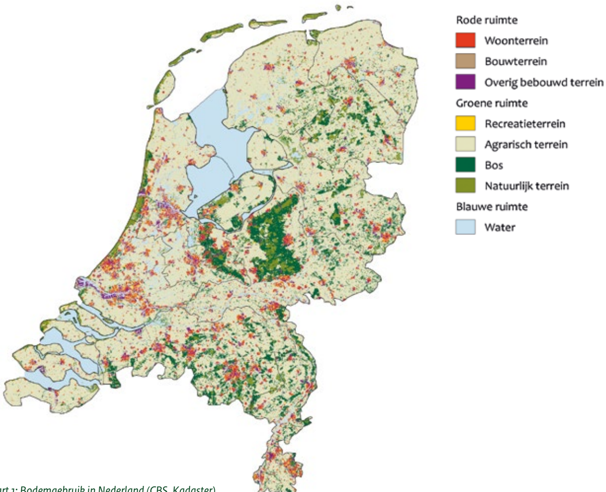
Kaart 1: Bodemgebruik in Nederland (CBS, Kadaster)

Maar soms moeten we andere keuzes maken, om bijvoorbeeld de veiligheid te borgen of om ruimte te creëren voor nieuwe woningen. In het reguliere beheer worden bomen gekapt voor verjonging en productie (zie het thema 'Vitaal bos'). Ook is het soms nodig om bos om te vormen naar andere typen natuur. Dat komt omdat het in Nederland slecht is gesteld met de plant- en diersoorten die afhankelijk zijn van open landschappen, zoals heide. Dit komt vooral door de hoge stikstofneerslag. We blijven daarom de herstelmaatregelen voor deze kwetsbare natuur uitvoeren.