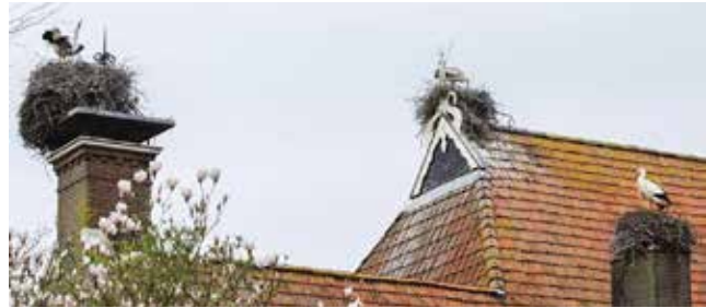
Drie van de vier door ooievaars bezette nesten op het dak.

Er is achterstallig onderhoud. Na meer dan dertig jaar boeren en zware persoonlijke tegenslagen is mijn metgezel anders gaan werken, om het vol te houden. We moeten als mens onze beperkingen aanvaarden. Wij