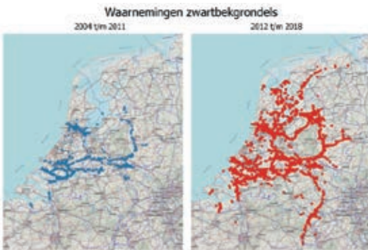
Verspreiding van de zwartbekgrondel in Nederland gevisualiseerd over twee opeenvolgende tijdsreeksen (2004-2011 en 2012-2018).

dichtheden in het benedenrivieren-gebied en Noordzeekanaal flink toe. Van 2004 tot en met 2011 koloniseerde de soort een aantal Nederlandse rivieren, waaronder de Waal, het Hollandsdiep, het Haringvliet en de IJssel. Daarna verspreidde de soort zich naar andere grote wateren zoals de Maas, IJsselmeer, Markermeer en Randmeren. Ook een aantal kleinere systemen – waaronder het Twentekanaal, het Schelde-Rijnkanaal, de Kromme Rijn, de Delftse Schie, diverse Friese meren en omliggende watergangen – werden gekoloniseerd.