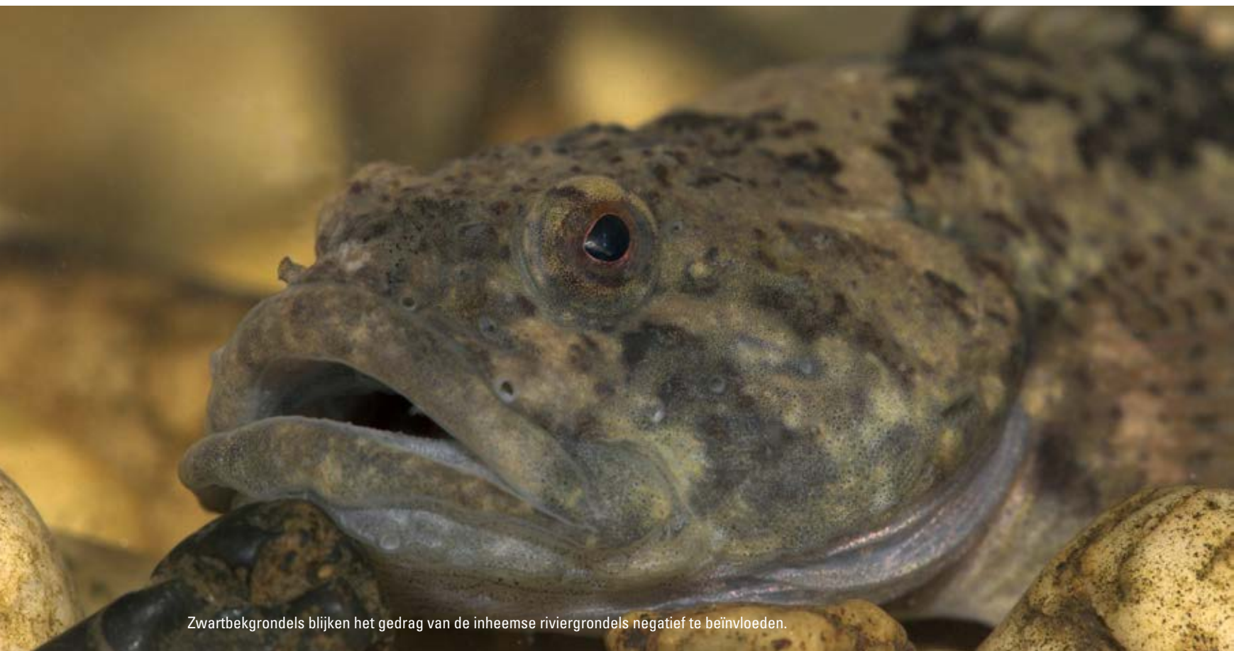
Zwartbekgrondels blijken het gedrag van de inheemse riviergrondels negatief te beïnvloeden.