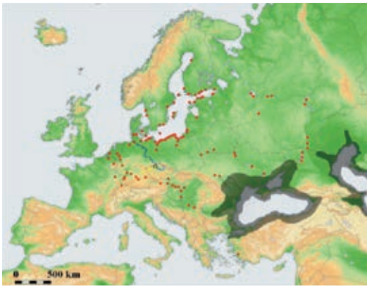
Verspreiding van de zwartbekgrondel, Neogobius melanostomus , tussen 2002 en 2015 in Europa. De rode stippen geven de verspreiding aan. Het oorspronkelijk leefgebied is grijs gearceerd.

dichtheden in het benedenrivieren-gebied en Noordzeekanaal flink toe. Van 2004 tot en met 2011 koloniseerde de soort een aantal Nederlandse rivieren, waaronder de Waal, het Hollandsdiep, het Haringvliet en de IJssel. Daarna verspreidde de soort zich naar andere grote wateren zoals de Maas, IJsselmeer, Markermeer en Randmeren. Ook een aantal kleinere systemen – waaronder het Twentekanaal, het Schelde-Rijnkanaal, de Kromme Rijn, de Delftse Schie, diverse Friese meren en omliggende watergangen – werden gekoloniseerd.