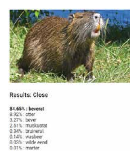
Fotoanalyse van een beverrat door het model. Het percentage geeft de kans weer dat het dier op de foto overeenkomt met de analyse.

Er is een PoC (Proof of Concept) uitgevoerd in een gesloten ruimte op de HAS Hogeschool te 's-Hertogenbosch. De apparatuur werd voorzien van stroom door een powerbank die het systeem voor ongeveer 120 uur stroom kon leveren. Internetverbinding vond in deze eerste test plaats via Wifi. Er is in deze testfase met behulp van foto's aangetoond dat verscheidene diersoorten door beeldherkenning onderscheiden konden worden. Vervolgens is de kooi, in de opstelling zoals die is beschreven bij