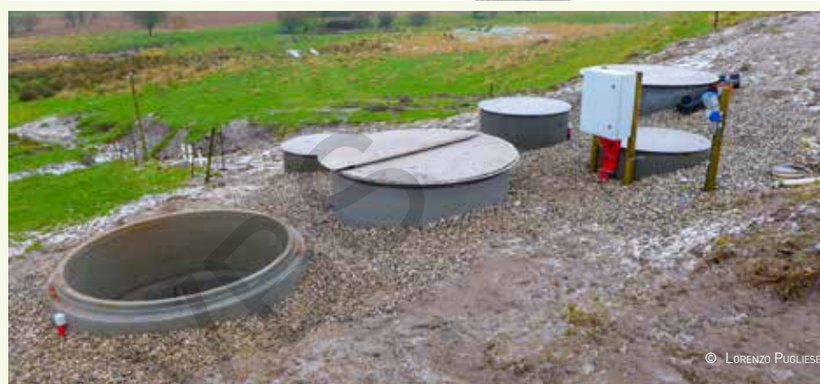
De inline installatie in Denemarken

besturingsbord maakt het mogelijk om de instroom en het waterniveau in de verschillende putten continu te bewaken. De monitoringperiode loopt van het najaar tot eind april (drainageseizoen).