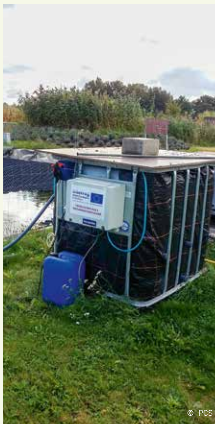
Nieuwe opstelling (2019) van MBBR-filter op het PCS