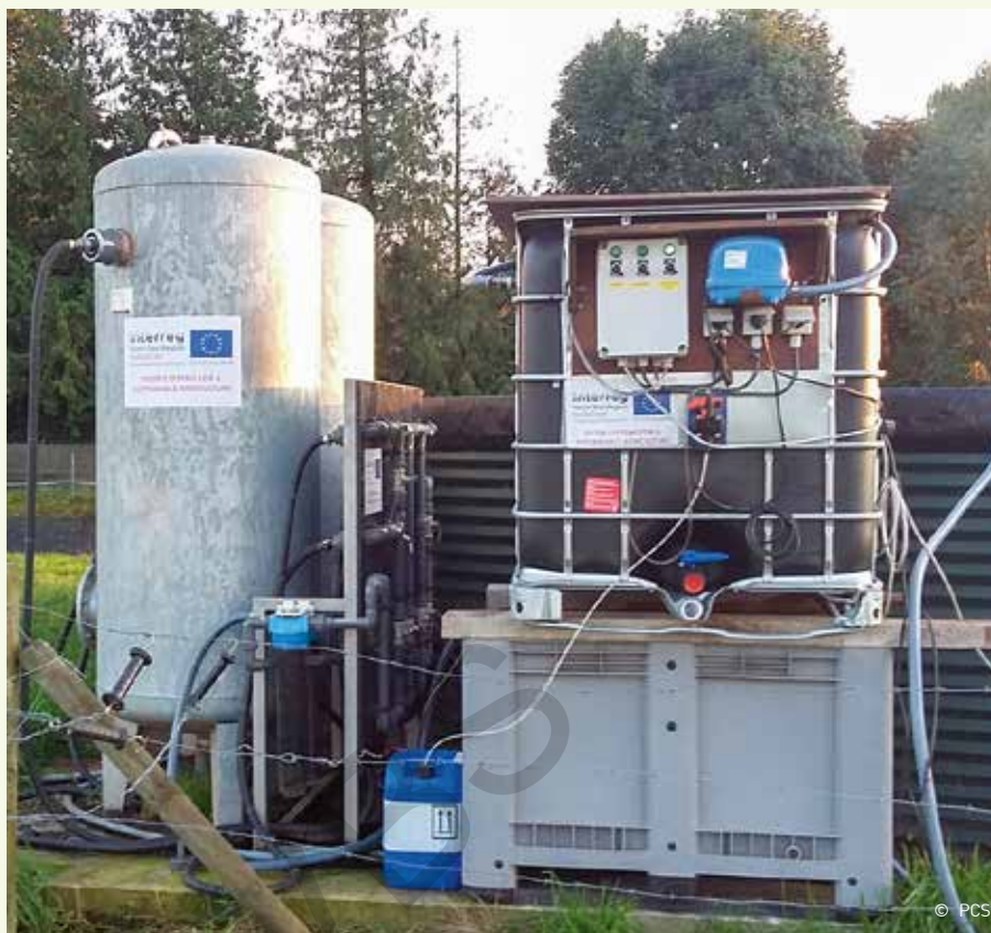
P-filters en MBBR bij Goderick Meuninck.

duen van gewasbeschermingsmiddelen een negatieve invloed kunnen hebben op de denitrificerende werking.