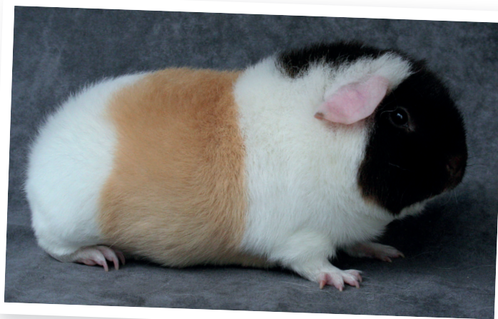
US-Teddy driekleur zeug. (JS)

Geslachtsrijp zijn ze al met 5-8 weken. Ze kunnen in die korte tijd voor heel wat nakomelingen zorgen. Ratten draaien hun poot niet om voor 8-12 jongen per worp. De Syrische hamster blijft hierbij niet achter en sommige muizenmoeders ook niet. Konijnen en cavia's blijven hierbij wat bescheidener met bij de konijnen 3-4 bij de dwergen tot wel meer dan 12 bij de grote rassen. In 1973 had ik een nest Groot Lotharings van 18 stuks met één niet goed getekende erbij. Een worp cavia's varieert van 1-7, maar meestal zijn het 2-4 stuks.