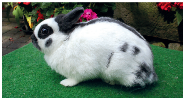
Lotharingerdwerg blauwe voedster. (GG)

Hoe kleiner de knagers hoe korter hun leven, want ratten, hamsters en muizen leven bijna nooit langer dan 3 jaar. Maar in die jaren gebeurt er heel wat! Ze zijn namelijk al vanaf ongeveer 10 weken voor de fok te gebruiken. Al zal de sportfokker er liever nog een paar weken mee wachten. Bij hamsters en muizen is de tijd dat ermee gefokt kan worden ongeveer 12 maanden en bij de ratten 15 maanden.