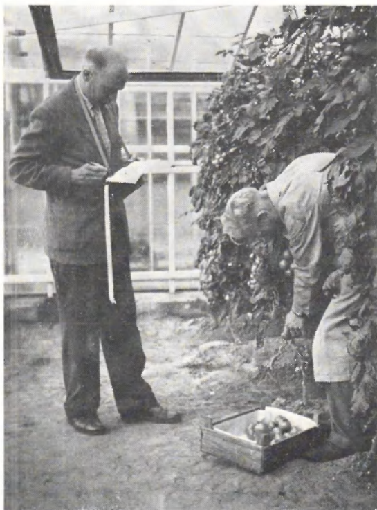
Bestudering van de werkmethode

van het evenwicht tussen arbeidsbehoefte en arbeidsaanbod. Dit herstel is nodig, willen wij profiteren van de resultaten van het tuinbouwkundig onderzoek.