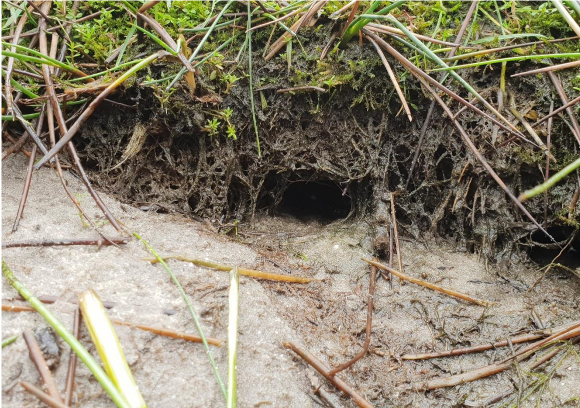
Afbeelding 3. Een oeverhol van een rode Amerikaanse rivierkreeft is herkenbaar aan de enigszins platte onderkant en ronde bovenkant

De kreeftenholen zijn geteld in 189 transecten van 10 meter in een gebied met relatief hoge dichtheden van rode Amerikaanse rivierkreeften. Dit studiegebied betreft drie weteringen in het Land van Maas en Waal in Gelderland (beheergebied van waterschap Rivierenland) met een breedte van ongeveer 8 meter en een diepte van 1,5 meter. De natuurlijkheid van de oevers is onderverdeeld in drie categorieën: 1) niet-natuurlijk (steil zonder vegetatie; n = 77 ), 2) semi-natuurlijk (steil met vegetatie; n = 50 ) en 3) natuurlijk (glooiend met vegetatie; n = 62 ). Alleen de hollen onder het normale waterpeil zijn geteld.