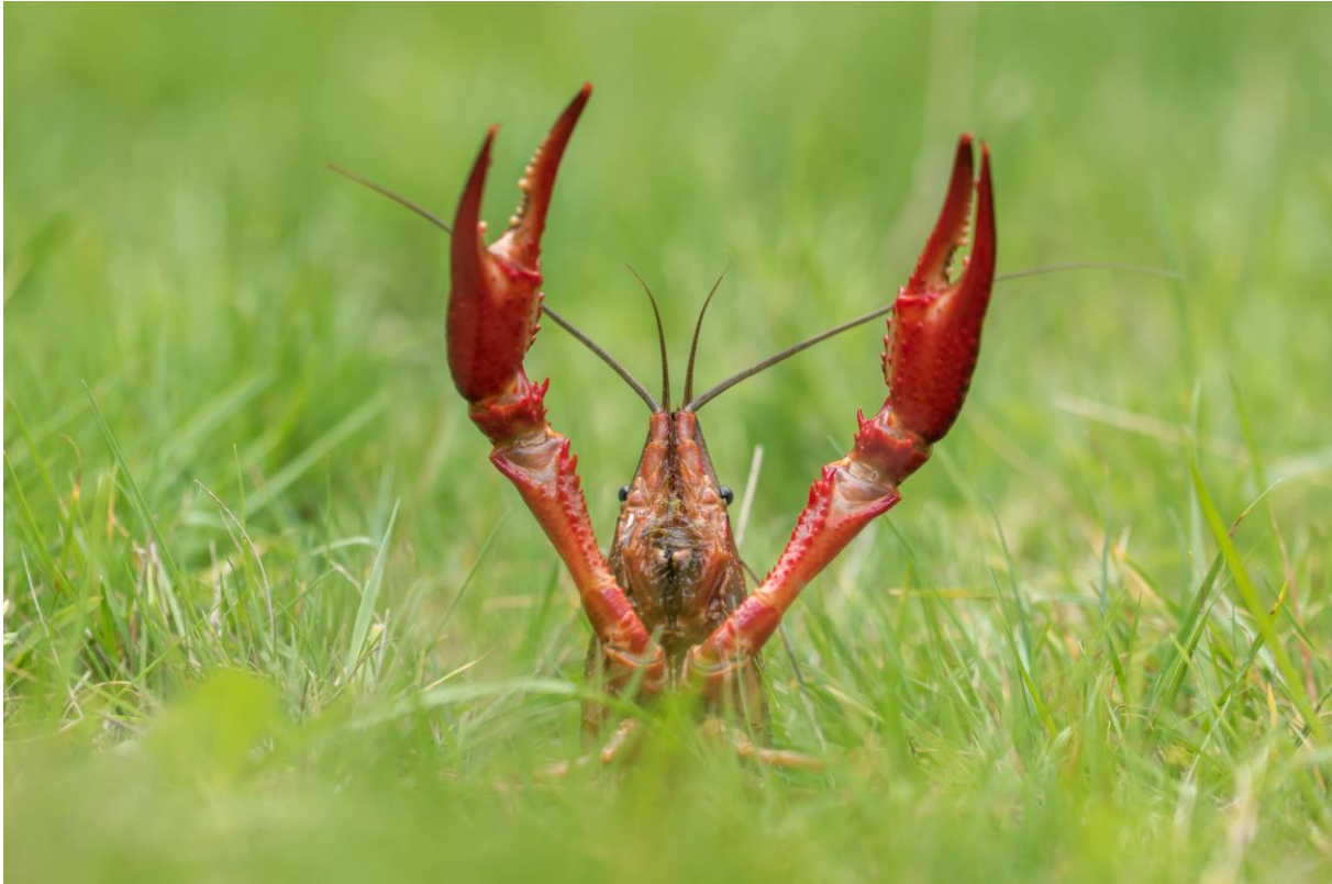
Afbeelding 1. De rode Amerikaanse rivierkreeft is een sterke graver en koloniseert snel nieuwe (geïsoleerde) wateren doordat dieren in het najaar het water verlaten en zich over land verspreiden