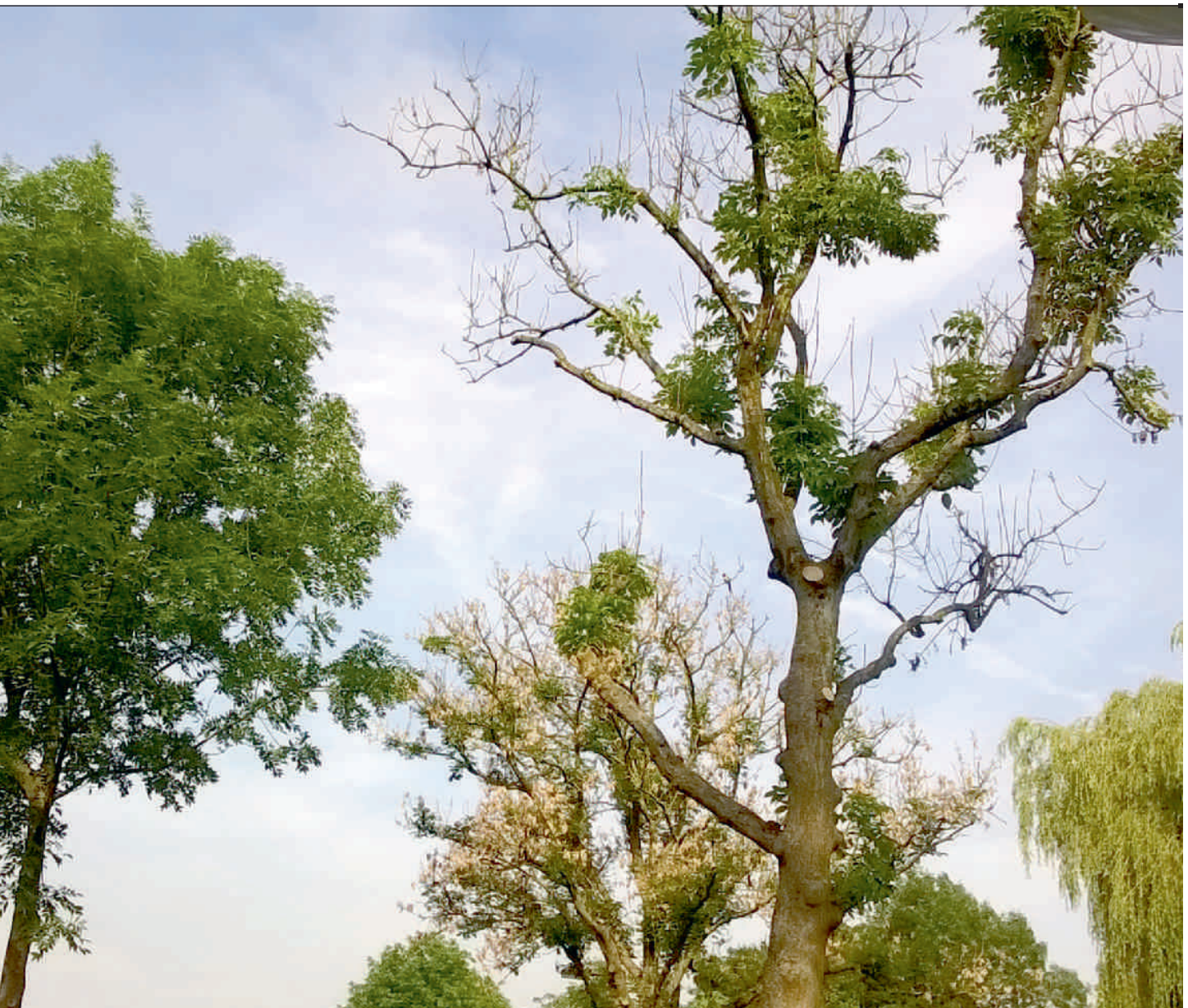
Zaailingen van essen laten vaak een grote (genetische) variatie zien in vatbaarheid voor essentaksterfte.