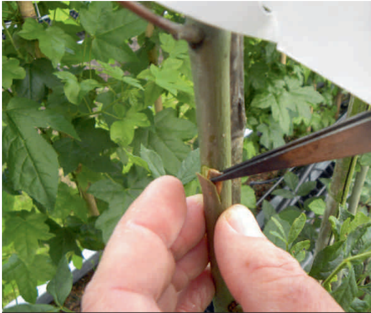
Kunstmatige infectie (inoculatie) door middel van het plaatsen van een stukje hout met daarop de schimmel onder de bast van de proefbomen.