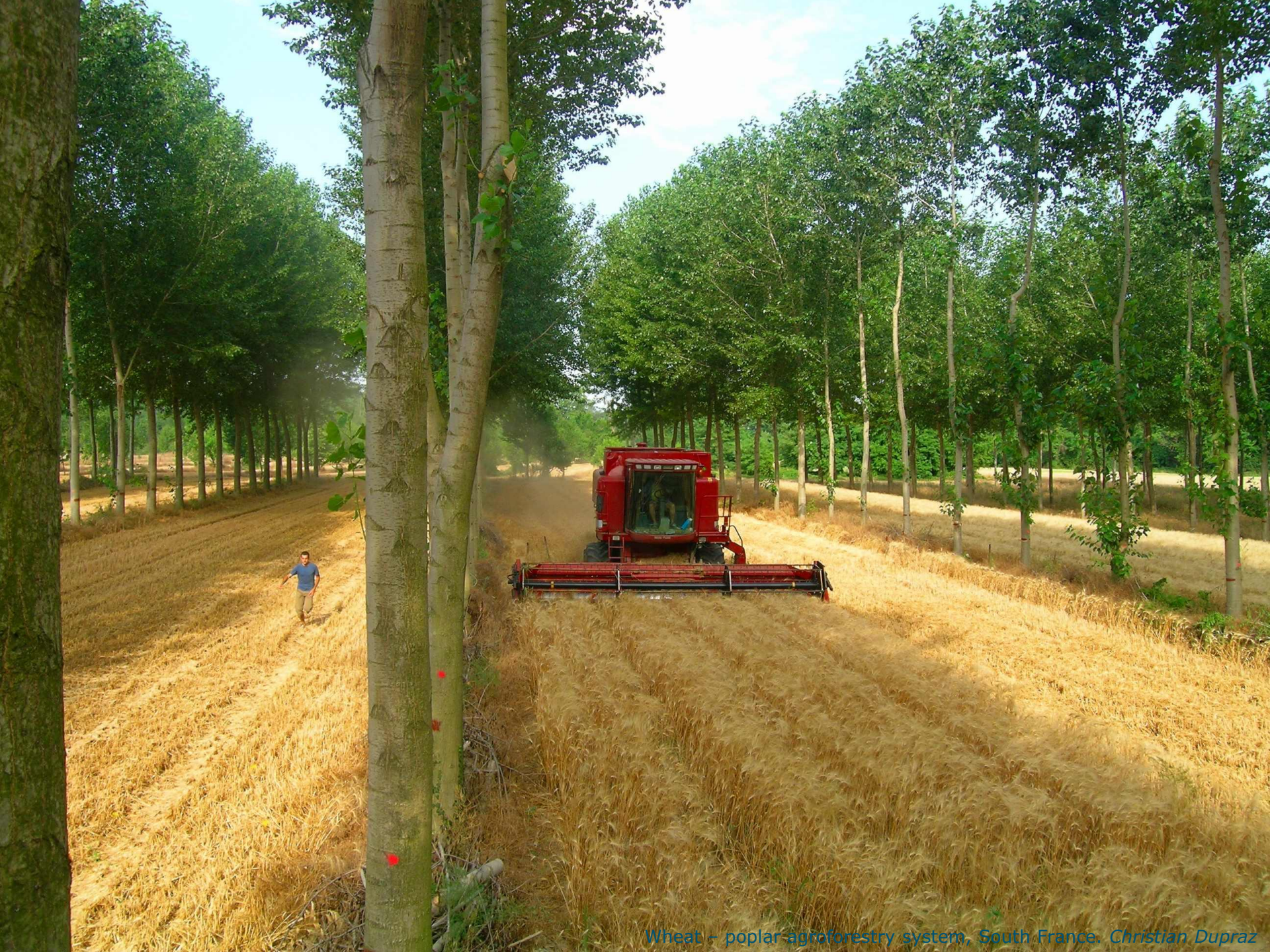
Wheat – poplar agroforestry system, South France. Christian Dupraz