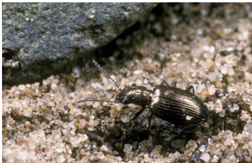
Figuur 5. Bembidion punctulatum is een specifieke soort van onbegroeide rivieroevers. Bembidion punctulatum is a characteristic species of bare river banks.

livens (zeldzame soorten van natte (ooi)bossen). Badister peltatus is een zeldzame soort van oevers met een schaduwrijke vegetatie. Opvallend is dat een aantal van deze soorten ( Bembidion harpaloides , Badister peltatus ) zowel op de beschaduwde rivieroever als in het natte wilgenbos voorkomt, ondanks het vrijwel ontbreken van ondergroei in de eerste plantengemeenschap.