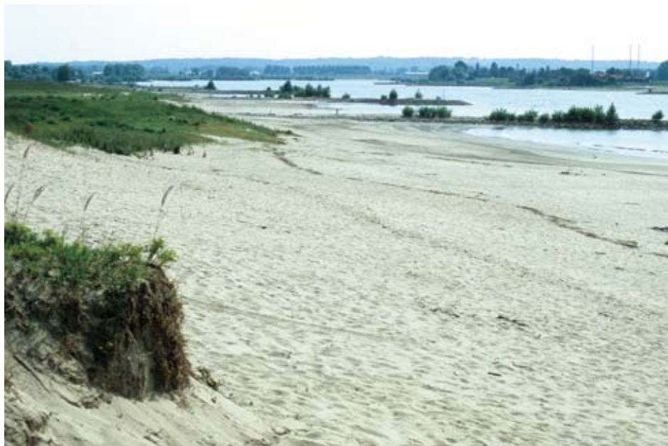
Figuur 1. In de Millingerwaard heeft de Waal een grote invloed op de geomorfologie en de vegetatie. The river Waal has a significant influence on geomorphology and the vegetation in the Millingerwaard, Gelderland.

gende habitattypen en vegetatiezonering. In het voorjaar van 2004 hebben we langs een transect loodrecht op de rivier zowel het voorkomen van de loopkeversoorten als de relatie tussen loopkeversamenstelling, vegetatiesamenstelling, vegetatiestructuur en milieufactoren onderzocht.