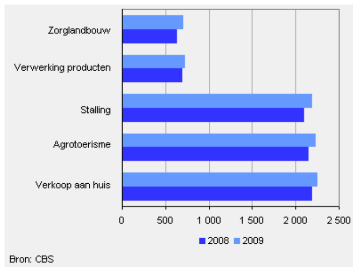
Aantal landbouwbedrijven met verbredingsactiviteiten

Ruim 7 van de 10 bedrijven die aan verbreding doen behaalden in 2008 minder dan 10% van de bedrijfsomzet uit verbreding. Ongeveer een kwart van de bedrijven met verbreding genereerde tussen de 10 en 50% van de bedrijfsopbrengsten uit verbreding. Slechts 5% ziet meer dan 50% uit de verbredingstak komen. Verbreding biedt dus voor een beperkt aantal ondernemers een substantiële bijdrage aan het inkomen.