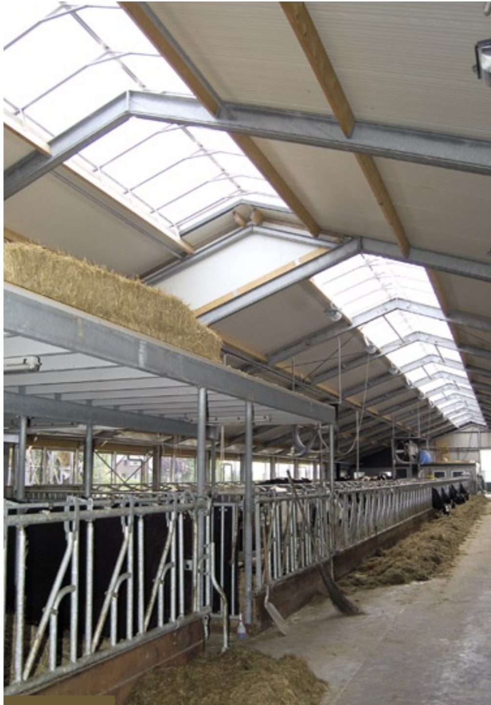
Lichtstraat in het dak

De twaalf jaar oude ligboxenstal van Jan van den Hengel uit Bunschoten (U) is in een volledig 'nieuwe jas' gestoken. Alle binnenwerk werd vernieuwd en ook werd de stal met 50 meter verlengd. De oude stal zat met 80 koeien helemaal vol. Ook waren de stalmaten aan de krappe kant voor de grote koe van tegenwoordig.