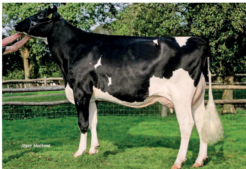
De excellente Bouw Goldwyn Femmy, moeder van Snowfever

Een sterk fokkende koefamilie als die van Femmy krijgt ook kansen in het hoornloosheidprogramma. Met Delta Fair PP (v. Rafter P) is er een homozygoot hoornloze stier die via een dochter van Ohare P uit een volle zus van Snowfever komt. Bij zwartbont heet de jongste veelbelovende Bouwstier Delta Floris (v. Empire), die beperkt beschikbaar is, omdat de stier niet meer leeft. Zijn moeder is een Reflectordochter, gevolgd door de met 89 punten ingeschreven Delta Fay, Man-O-Mandochter Feline en dan Femmy. Daarmee staat Floris iets verder af van de familielijn van de momenteel veelgebruikte Bouwstieren. ‘En dat zorgt weer voor nieuwe kansen voor deze koefamilie.’