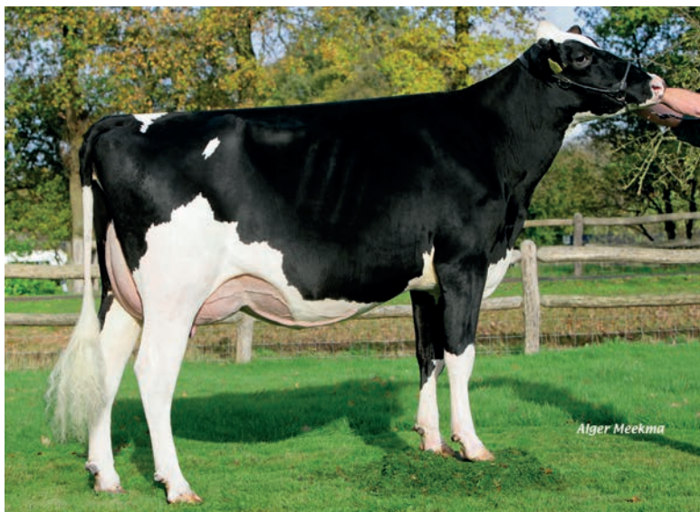
Bouw Goli Flower (87 punten), moeder van Rocky