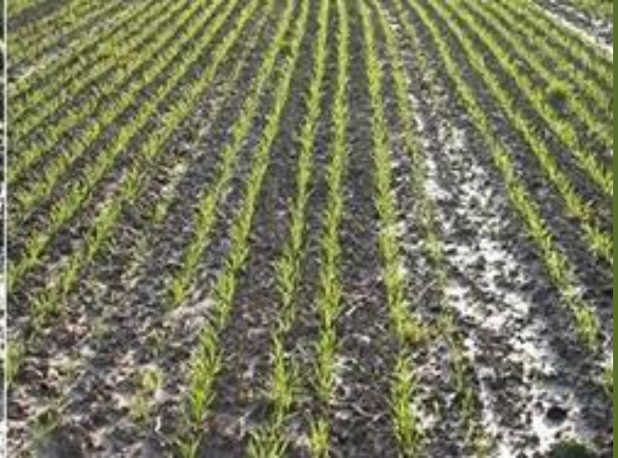
Biodynamische maisakker ernaast

(Langjarig (sinds 1978) vergelijkend DOK-onderzoek op het FiBL)