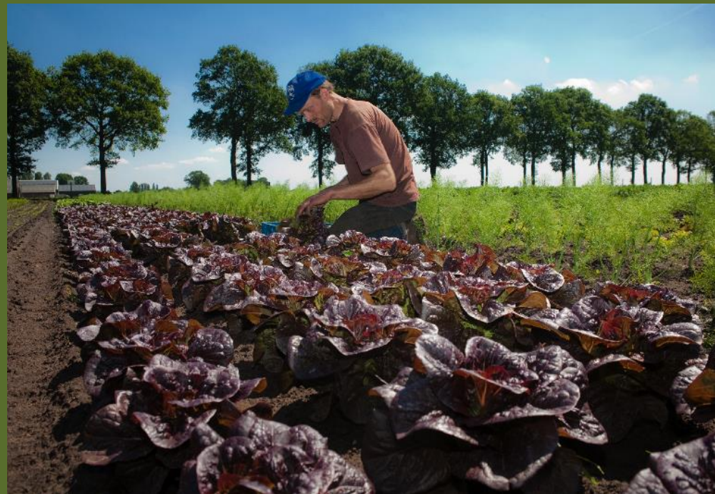
BD-tuinderij 't Leeuweriksveld