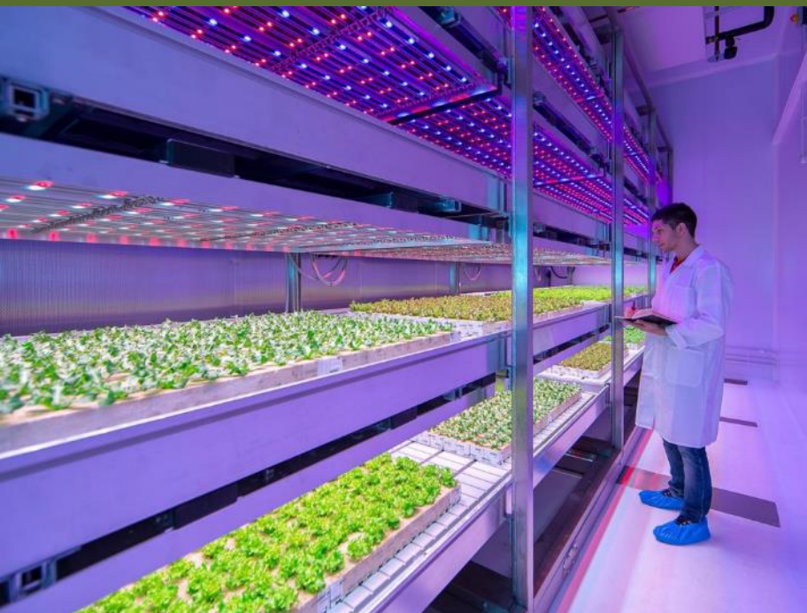
Sla telen zonder aarde en zonder zon