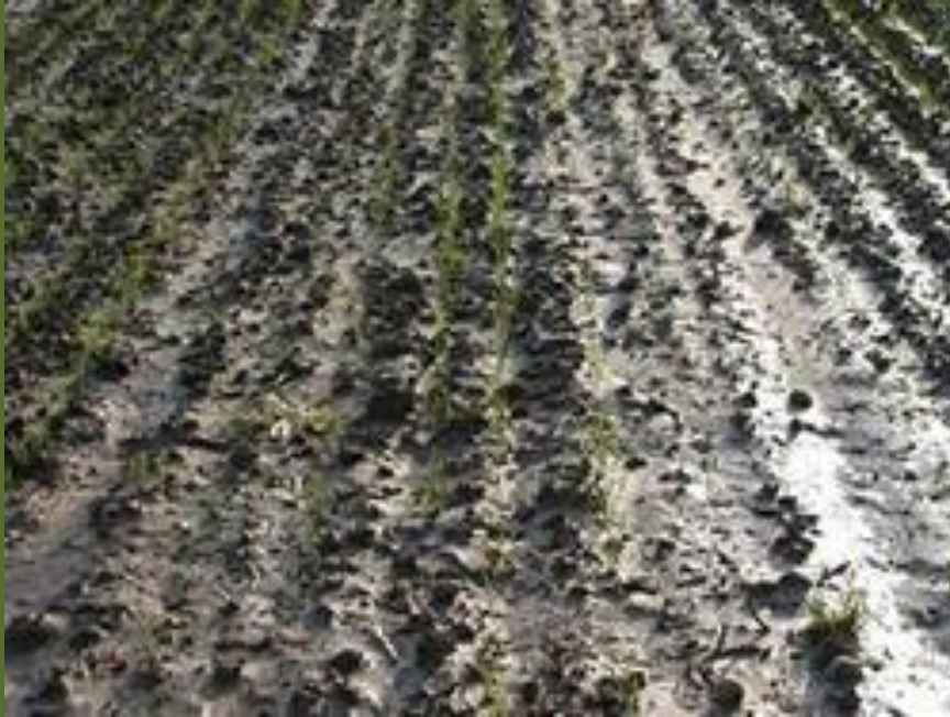
Gangbare maisakker na stortbui