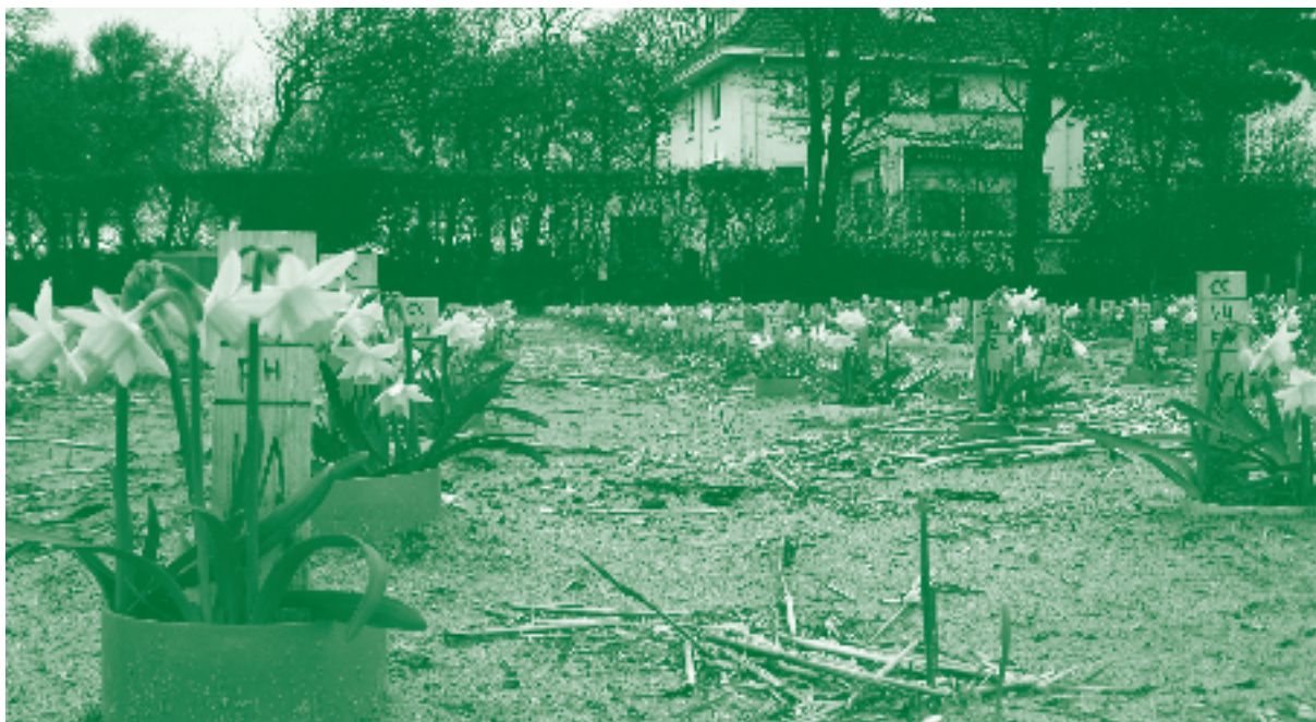
Biofotoets met Pratylenchus penetrans in narcis

De biofotoets met Pratylenchus penetrans in narcis wordt uitgevoerd in smalle buizen (doorsnede 10 cm, diepte 60 cm) gevuld met grond, die in de buurt van het proefveld worden ingegraven. Het inoculum is een aaltjessuspensie, die wordt aangegoten op de grond. Vóór het einde van het teeltseizoen worden de narcissen geroid en de wortels schoongespoeld om de mate van wortelrot te beoordelen: hoe meer wortelrot, hoe minder ziektevering. Het vertalen van de resultaten van de biofotoets naar effecten onder praktijkomstandigheden is hier in principe relatief betrouwbaar omdat het toetsgewas relevant is voor de sierteelt