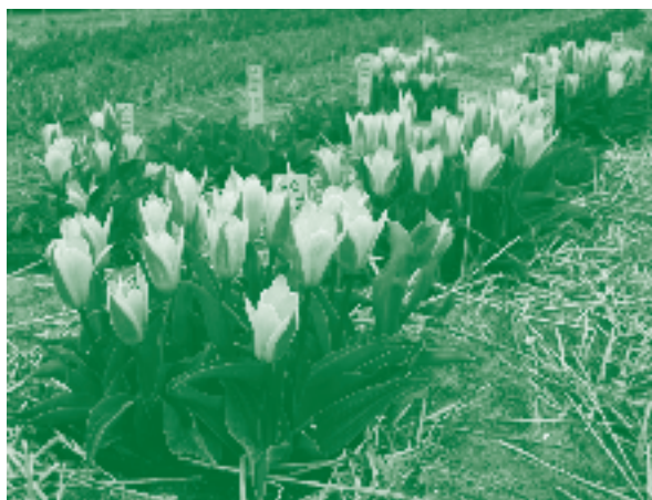
Biotoets met Rhizoctonia solani in tulp

De biotoets met Rhizoctonia solani in tulp wordt ook uitgevoerd onder veldomstandigheden in ingegraven vijvermandjes (12 l). Het inoculum is een aantal met Rhizoctonia gekoloniseerde haverkorrels in het midden van het mandje. Van daaruit groeit de schimmel door de grond naar de tulpenbollen toe. De meest nauwkeurige meting voor de mate van aantasting is de bolopbrengst. Hoe hoger de opbrengst des te beter de ziektevering. Gewas en omstandigheden zijn conform de praktijk. Echter, de bolopbrengst wordt behalve door de aantasting ook beïnvloedt door het organische-stofgehalte in de grond (betere structuur, beschikbaarheid van voedingsstoffen en water). Ook bij deze biotoets zijn daarom besmette en onbesmette behandelingen ingezet, waarbij het verschil tussen beide een maat is voor de ziektevering.