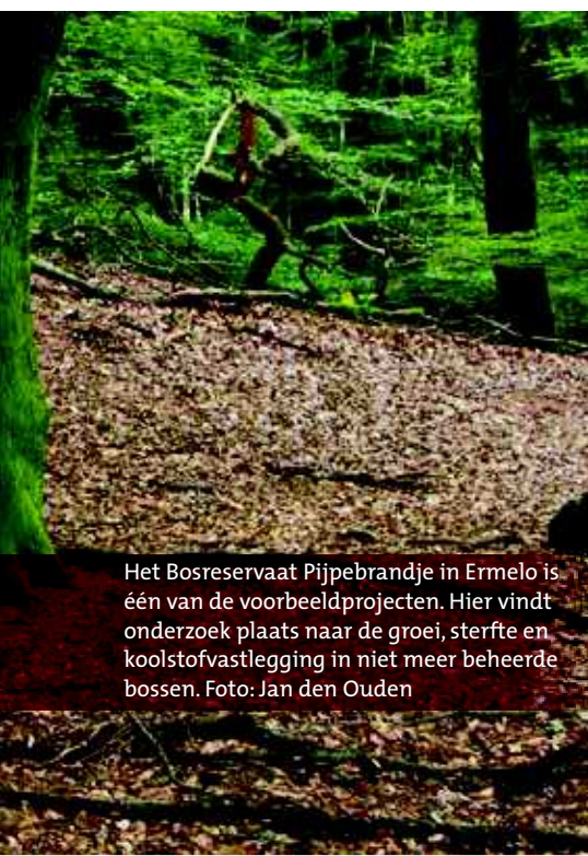
Het Bosreservaat Pijpebrandje in Ermelo is één van de voorbeeldprojecten. Hier vindt onderzoek plaats naar de groei, sterfte en koolstofvastlegging in niet meer beheerde bossen.