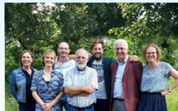
Het kernteam van het KCNL

“Veel bedrijven vinden het belangrijk om bij te dragen aan de ontwikkeling van het onderwijs”