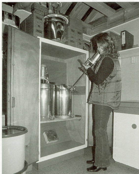
Zelfgebouwde roerinstallatie in een warmtekast, hygiënisch en doeltreffend.