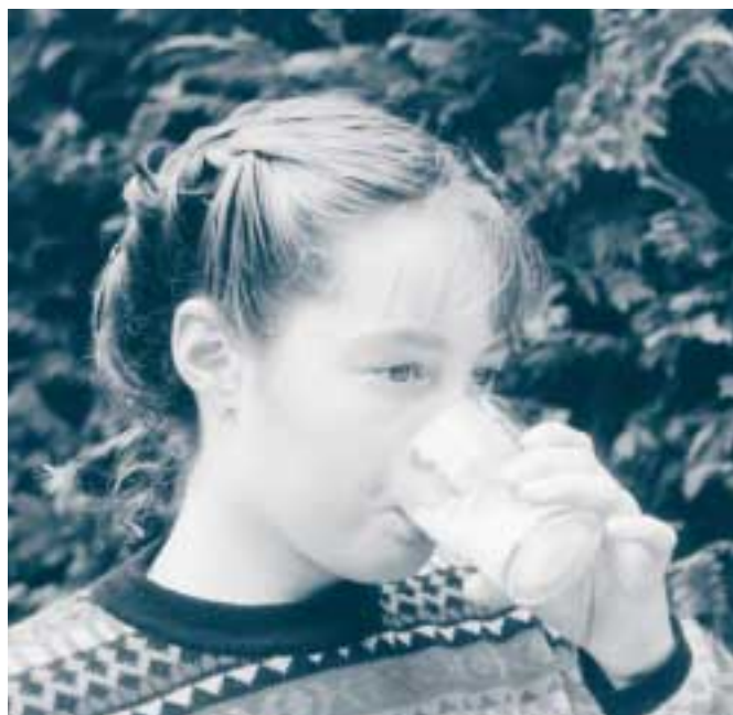
Welke eisen stelt de consument aan duurzaamheid?

Gebruik grondstoffen van onbesproken bron heeft betrekking op de maatschappelijke verantwoordelijkheid van leveranciers (vb. mengvoederfabrieken en farmaceuten). Weidegang is van invloed op dierwelzijn en landschappelijke waarde. Men vond echter dat weidegang als afzonderlijk meetpunt moest worden opgenomen. Naast voedselveiligheid zijn diergezondheid, dierwelzijn, landschappelijke waarde, gebruik grondstoffen van onbesproken bron en weidegang de overige belangrijke meetpunten voor extern sociale duurzaamheid. De resultaten liggen, met de recente crisis in de melkveehouderij, in de lijn der verwachting. Wel opvallend is dat het gebruik van gene-