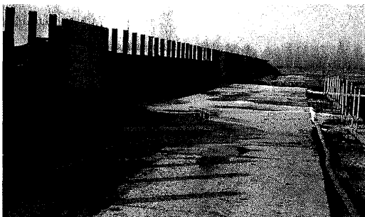
Foto's Mestscheiding op het Hongaarse Staatsbedrijf Törekzentmikios.