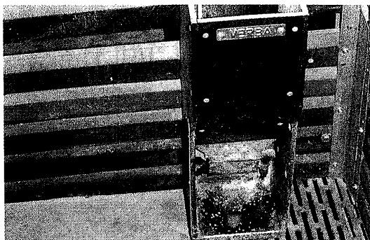
Brijbak met één vreetplaats

Naast technische en economische resultaten worden ook het drinkwaterverbruik, het optreden van oornecrose en/of oorbijten en het technisch functioneren beoordeeld. De eerste ronde is begin januari 1997 opgelegd. De resultaten van deze proef met biggen zullen begin 1998 beschikbaar komen. ■