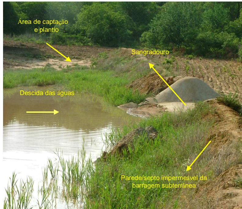
Figura 1. Barragem subterrânea.

A BS é uma das âncoras do Programa Uma Terra Duas Águas (P1 + 2), constituindo-se uma das opções de captação de água para produção de alimentos (SILVA et al., 2007). O P1 + 2 é um programa de convivência com o semi-árido, que pretende assegurar à população rural o acesso à terra e à água. Tem como princípio básico dotar cada família do semi-árido brasileiro (SAB) de Uma Terra (1), com tamanho suficiente para produzir alimentos, e Duas águas (2), uma para o consumo humano e outra para produção de alimentos e/ou criação de animais. O P 1 + 2 é um Programa de formação e mobilização social para convivência com o semi-árido brasileiro que está sendo implantado em alguns Estados do Nordeste, através de Unidades Pilotos, podendo ser incorporado a programas governamentais como a reforma agrária, "Programa Fome Zero e Sede Zero", "Programa de Combate à Desertificação" e o "Programa Hum Milhão de Cisternas (P1MC)" (GNADLINGER, 2005).