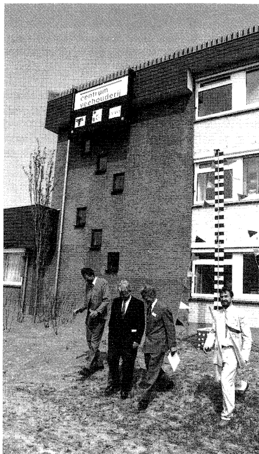
De klus is geklaard.

Alles bij elkaar heeft de bouw ongeveer twee en een half jaar geduurd. Als u eerder op het PR geweest bent herinnert u zich nog de houten behuizing die er ruim 15 jaar gestaan heeft. Het nieuwe Centrum is in een E-vorm gebouwd met drie vleugels, die 2 of 3 verdiepingen hoog zijn. Het gebouw heeft ruim 14 miljoen gulden gekost en biedt plaats aan ongeveer 250 medewerkers. Lelystad herbergt nu een Centrum dat op veehouderijgebied betekenis gaat krijgen. Dat past ook in de plannen die het Ministerie van Landbouw, Natuurbeheer en Visserij heeft over de concentratie van het veehouderij-onderzoek hier in de Flevo-polder. De opening zelf werd door zo'n 450 eigen medewerkers en genodigden bijgewoond.