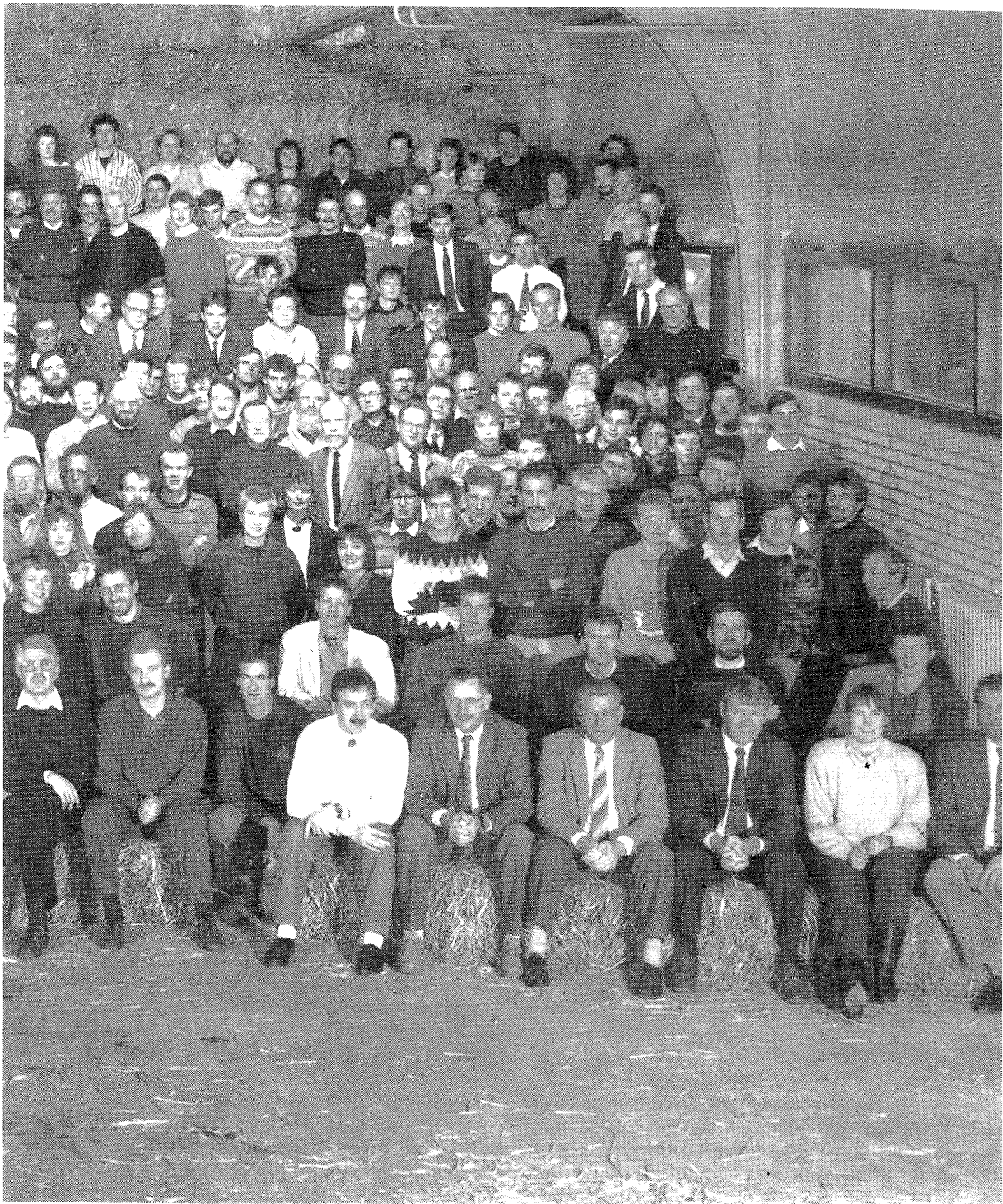
Veehouderij, januari 1991