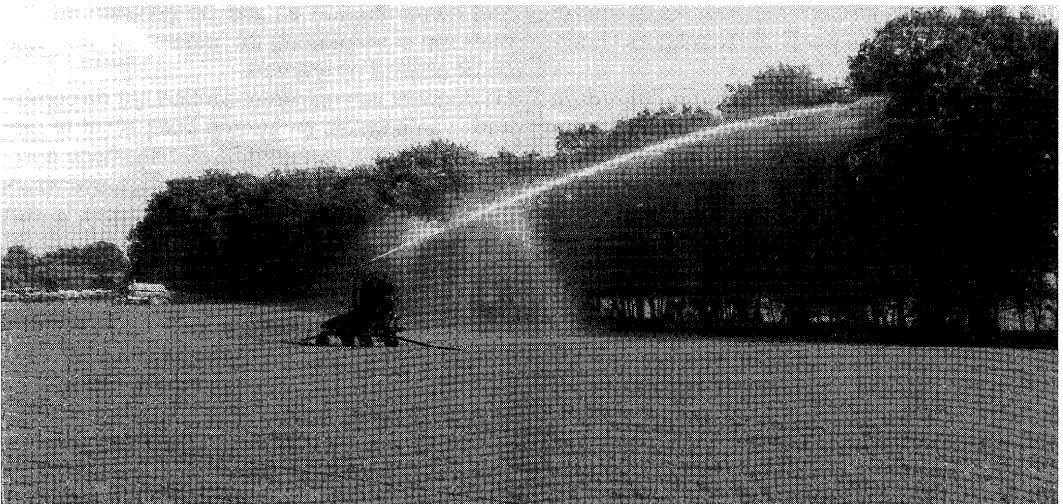
Het beregeningsverbod kan op droogtegevoelige zandgronden leiden tot grote opbrengstdalingen bij zowel gras als mais.