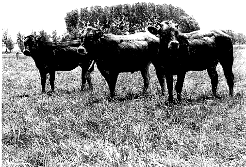
Intensief of extensief weiden van kruislingvaarzen.

dieren geïnsemineerd met sperma van op geboorteverloop geselecteerde Blonde d'Aquitaine stieren. Tijdens het stalseizoen werden ze met voordroogkuil, eventueel aangevuld met rundveebrok, op de norm gevoerd.