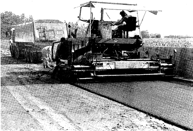
Gebruikswaarde toplaag van asfalt voor silovloer.