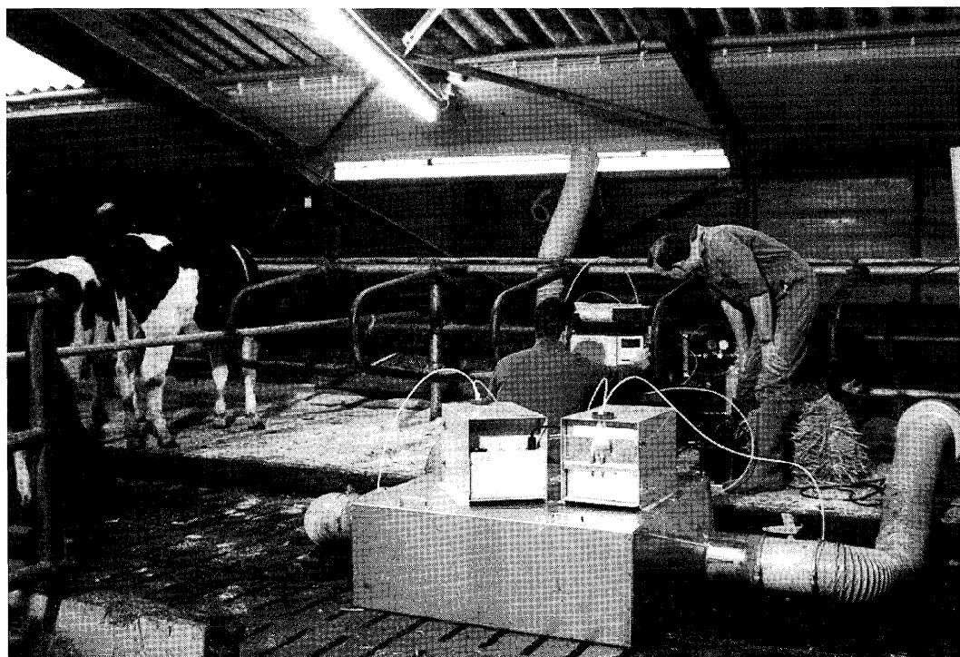
In het stalseizoen '92/'93 zijn veel ammoniak-emissiemetingen uitgevoerd.

Het doel van het onderzoek op ROC Aver Heino was het verlagen van het waterverbruik met behoud van een voldoende emissiereductie. Om dit te onderzoeken is gekozen voor twee niveaus