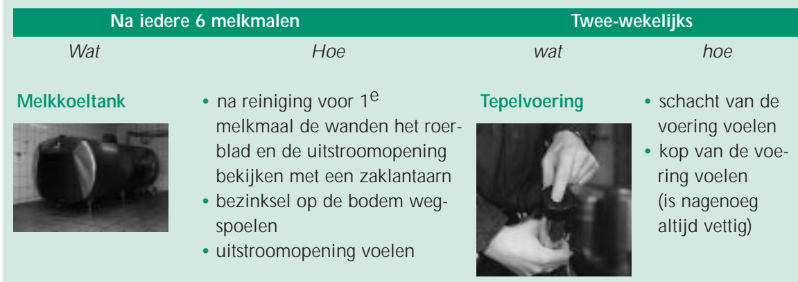
Figuur 2 Voorbeelden uit het controleprotocol voor veehouders

Droogzetters waren in 17 % van de gevallen de waarschijnlijke oorzaak van antibioticaresiduen in melk. Dit is opvallend veel. Het grootste deel van de bedrijven (86 %) zet alle koeien standaard droog met een droogzetter. Slechts 3 % van de bedrijven gebruikt nooit droogzetters. Het grootste deel van de gevallen van groeiremming, veroorzaakt door droogzetters, was toe te