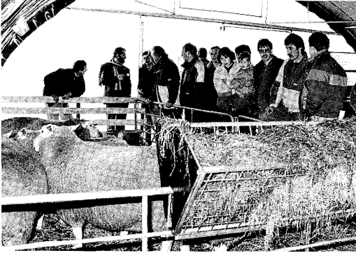
De nieuwe schapetunnel had veel bekijks.

20 jaar verwerkt?“. Een expositie die nog steeds de moeite van het bekijken waard is.