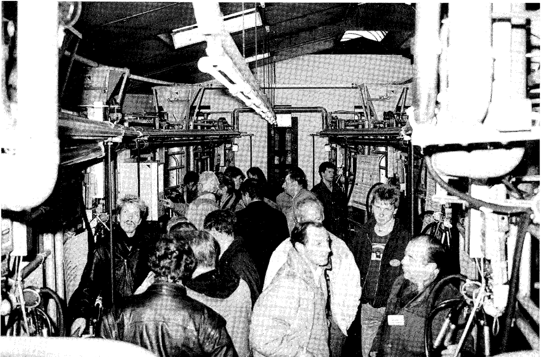
De 8-stands tandem melkstal. Geen plaats meer voor de koeien.

In de nieuwe informatieruimte stonden (en staan nog steeds) 15 panelen opgesteld met tekst, foto's en figuren over de relatie landbouw, onderzoek en milieu. Vragen als: „Wat is gras?” en „Is alleen regen zuur” zijn op luchtige en informatieve wijze beantwoord (o.a. met tekeningen van Piet de Vries). De centrale vraag van dit thema was: „Hoe heeft de bodem, de lucht en het water de enorme landbouwkundige ontwikkeling van de afgelopen