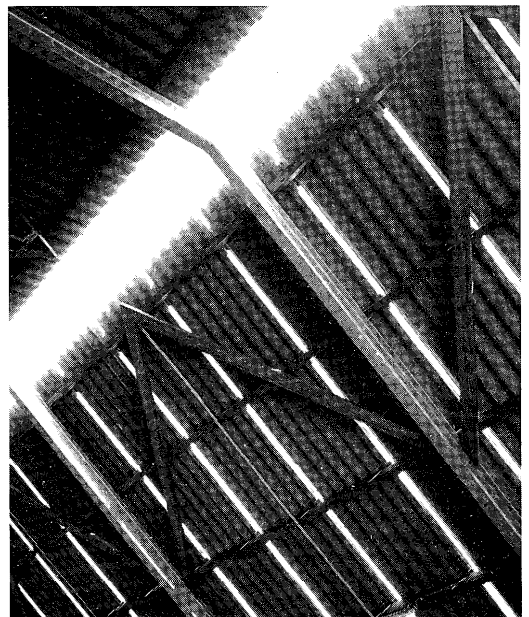
Dakspleetventilatie op Melkvee 4; elke spleet is 1 1/3 cm breed.

slag van een half jaar.. In werkelijkheid blijkt dit maar voor 4 maanden te zijn. Er is blijkbaar geen rekening mee gehouden dat een dergelijk grote kelder over zo'n lengte nooit helemaal leeg is te krijgen. Er blijft altijd wel gemiddeld 35 cm in staan. De mestgangen en wachtruimte zijn van roosters voorzien. In 1985/86 is aan één zijde van de melkveestal een mestschuif voor over de roostervloer ontwikkeld. Dit beviel zo goed dat in 1987 ook de tweede mestgang van een schuif is voorzien. Deze schuiven lopen één keer per uur over de roosters. De roosters zijn en blijven nu schoon, dus de koeien hebben droge en schone klauwen. We hebben nog nauwelijks last van klauwproblemen. De koeien lopen nu ook geen mest meer in